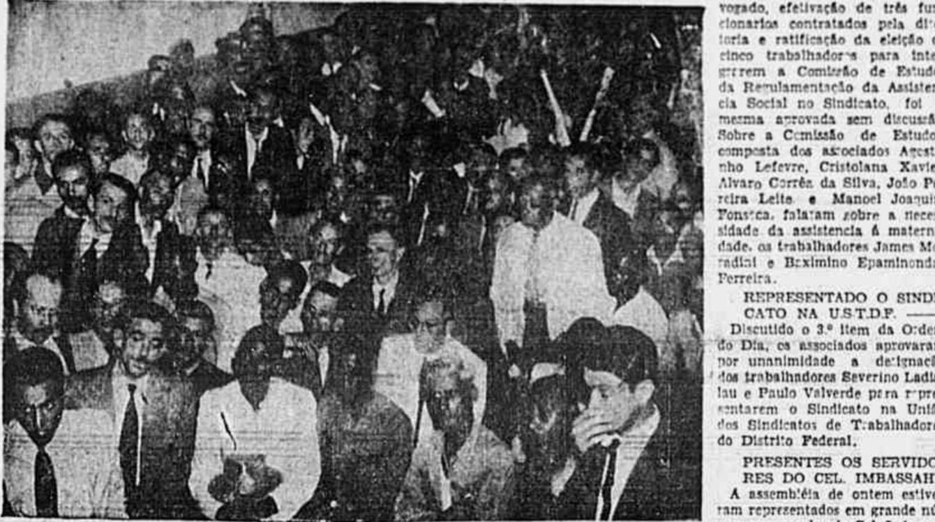
Aspecto da assembleia de ontem dos trabalhadores da Light

Está em sua fase final e defensiva a campanha dos trabalhadores da Light pela conquista da "Tabela da Vitória". A situação se agrava de dia para dia em virtude das constantes proteções da empresa em apresentar á Comissão Parlamentar uma solução concreta, e em virtude, também, da falta de amparo que os 30.000 explorados da Light têm encontrado por parte das autoridades. Assim, atingindo os últimos limites da capacidade de esperar uma solução que se distancia cada vez mais, os trabalhadores da Light acorrem em massa ao Sindicato da Energia Elétrica e Produção de Gás, onde se realizou uma assembleia geral ordinária, para discussão de assuntos relativos á rotina da vida interna daquele órgão do classe. Mais de mil trabalhadores compareceram na expectativa de receberem dos deputados que integram a Comissão Parlamentar, especialmente do deputado Domingos Velasco, da Esquerda Democrática, a palavra final que promettera para ontem, na reunião dos trabalhadores da Light, realizada sexta-feira no Sindicato dos Carris Urbanos.