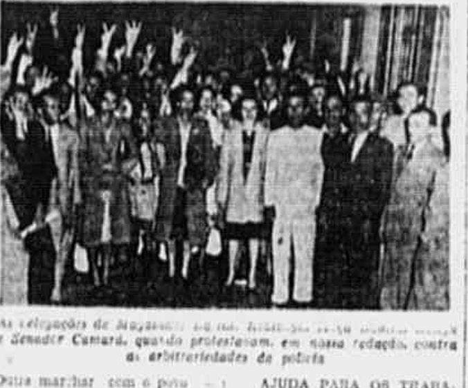
As delegações de Magalhães Bastos, Realengo, Moça Bonita e Senador Camará, quando protestaram em massa na redação...