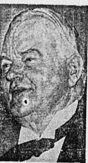
Hoover, embaixador da Wall Street, colateralista, inimigo de Roosevelt

ROMA, 11 (Do Edward Murdock correspondente da U. P.) — Por sugestão do ministro do Interior, Giuseppe Romita, cerca de cinquenta mil republicanos desfilaram esta noite pelas ruas de Roma, num esforço para levar o governo a acatar a vontade do povo demonstrada nas urnas, convertendo a Itália em Republica.