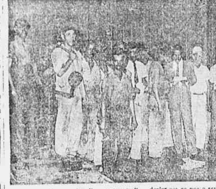
"O governo deve nacionalizar a empresa" — declarou um dos nossos reporteiros os ferroviários da Leopoldina