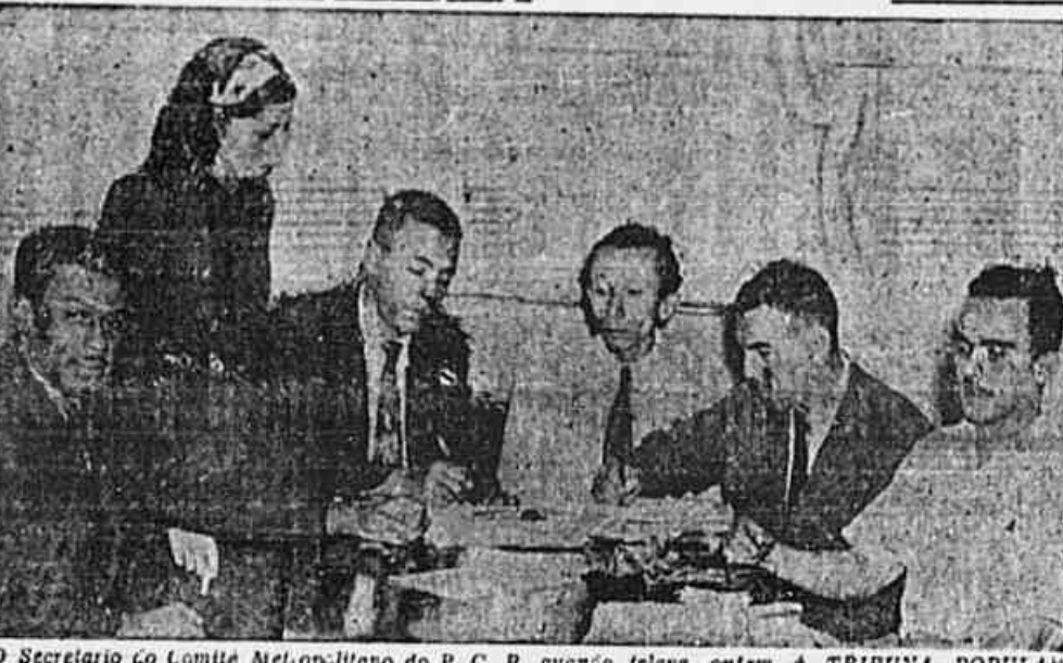
O Secretário do Comitê Metropolitano do P. C. B. quando falava, ontem, à TRIBUNA POPULAR.

Não se trata apenas de competência de competência de juízo, mas da própria monstruosidade que representam a prisão e o julgamento militar de trabalhadores por exercerem um direito universalmente reconhecido — Grave retrocesso em nossa marcha para a democracia — Unida e pacificamente organizados, o povo e os trabalhadores saberão arrancar os presos heróicos das garras da reação