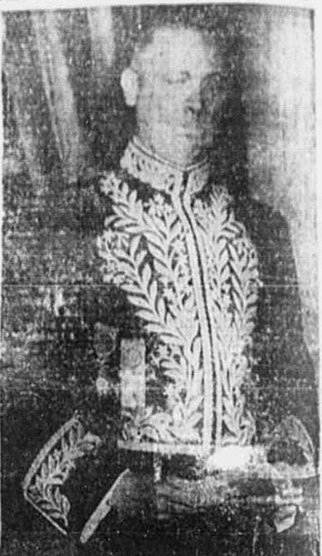
O escritor Peregrino Junior, ontem, na Academia Brasileira de Letras.