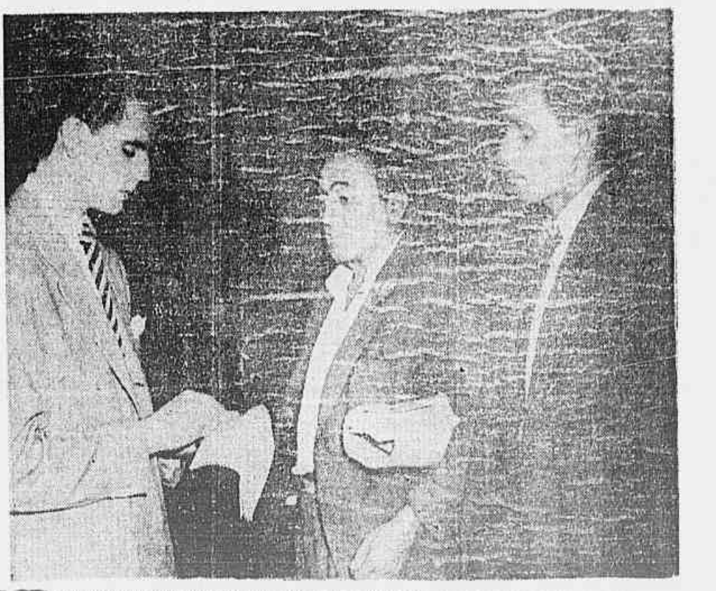
Dois trabalhadores, quando falavam à nossa reportagem, protestando contra os novos aumentos de preço.

Enquanto a dupla Lira-Fontenelle associa o nevoeiro anti-comunista, Chatô anuncia: "Outros aumentos virão" — Trabalhadores e populares falam à nossa reportagem, manifestando se contrários à elevação dos preços do açúcar, fósforo, manteiga e banha