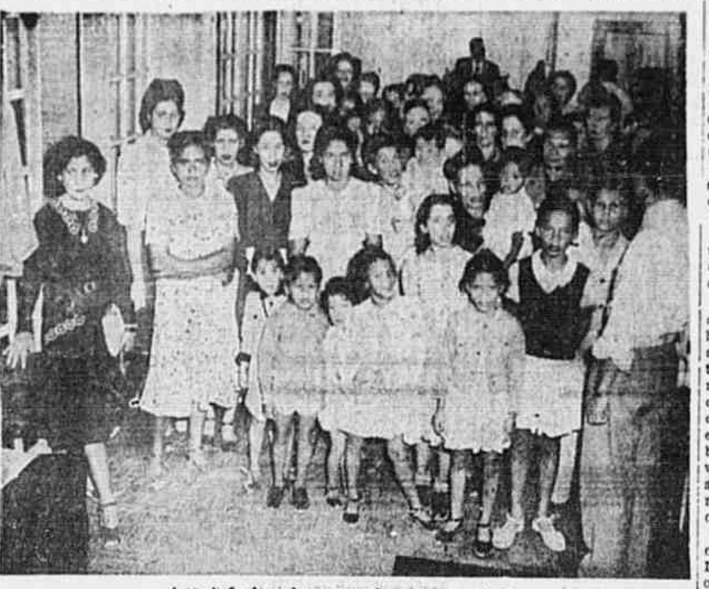
A comissão de senhoras, quando em nossa redação