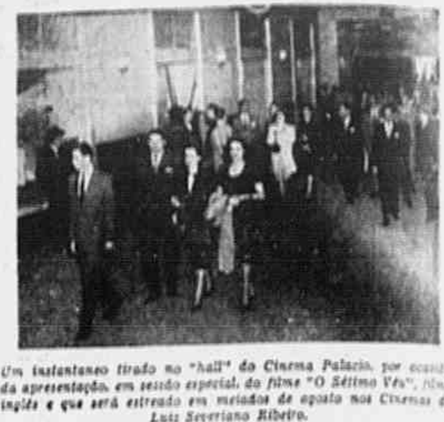
Um instantâneo tirado no "hall" do Cinema Palácio, por ocasião da apresentação, em sessão especial, do filme "O Sétimo Vento", cuja história e que será retratado em meados de agosto nos cinemas de Luiz Severiano Ribeiro.