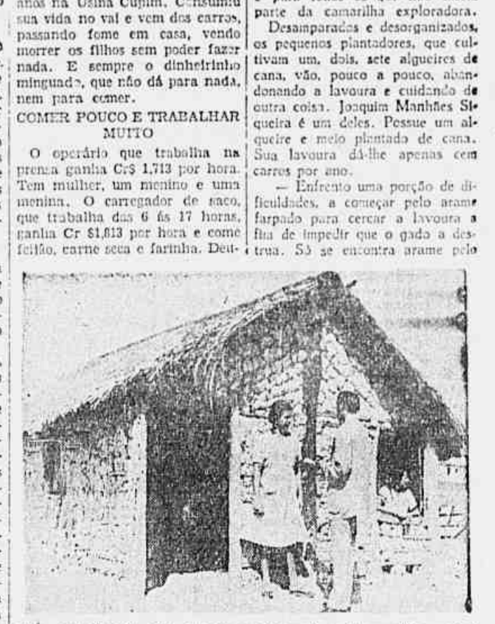
Uma cortadora de cana, em seu casebre, pelo qual paga 25 cruzeiros de aluguel, falando à TRIBUNA POPULAR.