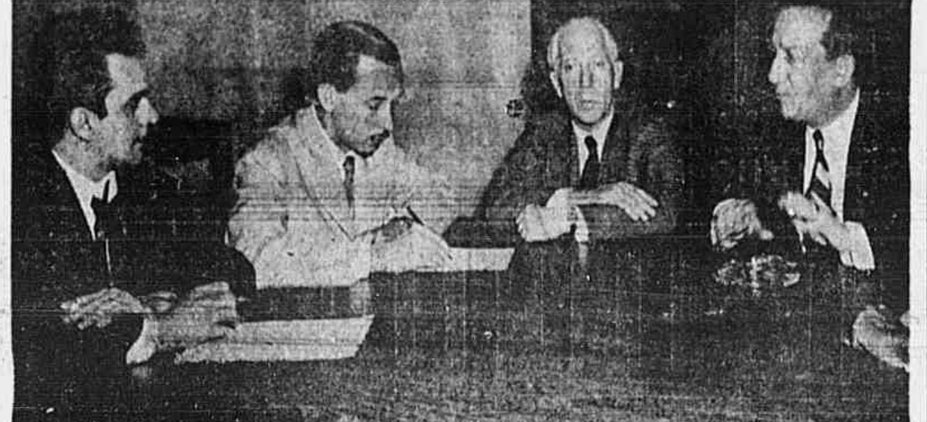
Flagrante da entrevista coletiva concedida ontem à imprensa pelo embaixador Benjamin Cohen, secretário geral adjunto da ONU (o primeiro à direita), na A.B.I. Ao centro, o sr. Herbert Moses.

Conforme já foi noticiado, encontra-se nesta capital o embaixador Benjamin Cohen, secretário geral adjunto da ONU. Sua viagem se prende, no Rio e em outras capitais sul-americanas, que ele visitará, aos objetivos do Escritório de Informações Públicas da ONU. Isto é, a mais ampla divulgação de como funciona, através de todos os Departamentos, a Organização das Nações Unidas.