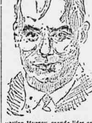
Philipp Murray, grande líder operário e colaborador de Roosevelt, presidente da F.M.S., em substituição a Citrine.

Figuras das mais conhecidas dos Estados Unidos, Grã Bretanha, França, México e URSS dirigem a grande Central Sindical filiada à ONU