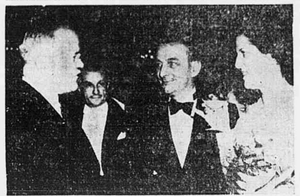
Presidente do Conselho francês, sr. Bidault, e sua esposa, em palestra amistosa com o Ministro das Relações Exteriores da URSS, V. Molotov...