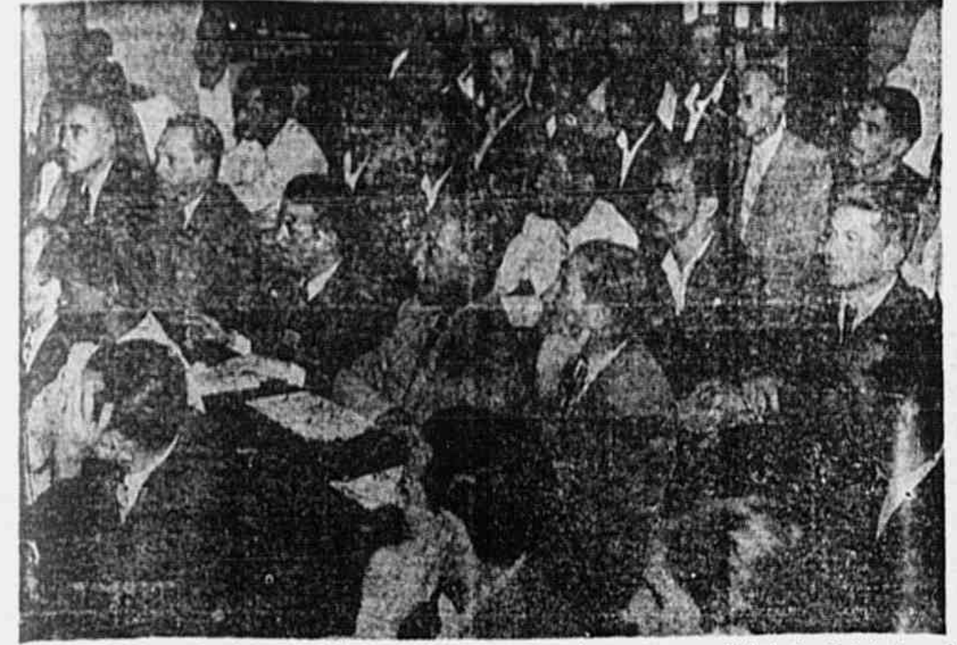
"Aspecto do plenário, quando atentos, os metalúrgicos ouviam a exposição sobre o Congresso Sindical dos Trabalhadores do Rio Grande do Sul."

"Cabe, Também, aos Metalúrgicos Apoiar Absoluta e Inrestritamente o Congresso Sindical Nacional"