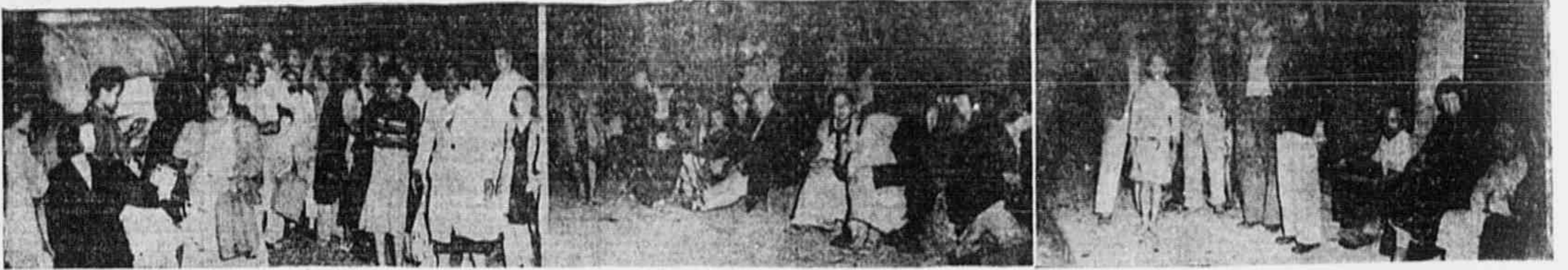
As filas são muitas e proliferam por toda a vasta cidade e os trabalhos. Para ouvir o povo e sentir de perto suas necessidades, a filiação de primeira necessidade, que custa caro e às vezes não aparece, embora o povo chegue a perder das horas à sua espera. As fotografias ao alto são: a primeira, um aspecto da fila de pão, às quatro horas da madrugada, na rua Bela de São Antonio, no Rio de Janeiro, com os seus litros e seus pobres apalhos bem, velhos e crianças na sua paciente espera. Uma criança dorme de cabeça para cima, junto a um muro.