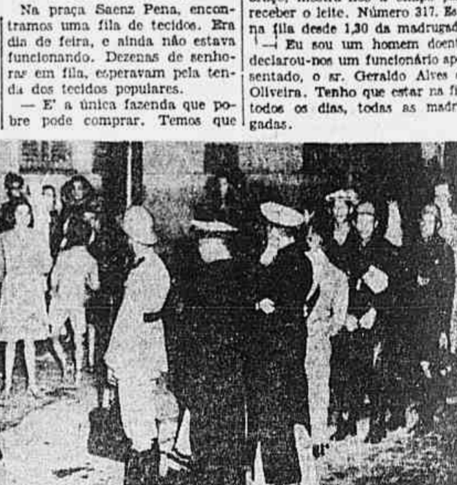
A fila dos militares, no Entreposto Central da CEL, começa mais tarde e acaba mais cedo. É uma fila a parte e por isso mesmo bastante menor que a do povo em geral que se estende como uma imensa serpente junto à amurada das casas da rua Solótero Reis. Em tempos de paz, como os que vivemos, não se justifica esse privilégio. O sacrifício ou a privação, já que existem, devem tocar a todos indeliberadamente.

Na rua Dias da Cruz a fila espera durante a madrugada por duas pipas de leite. Tão pouco leite para tão grande fila! Na rua D. Zulmira a fila chega até à rua Almirante Cândido do Brasil. Faz muito frio. A madrugada está mais clara. Mas a fadiga e a preocupação abatem os rostos. Aumentam a velhice dos velhos e tornam sombria a juventude destas moças mal-dormidas, a infância destas crianças mal protegidas que trocam os berços pelas pedras da calçada.