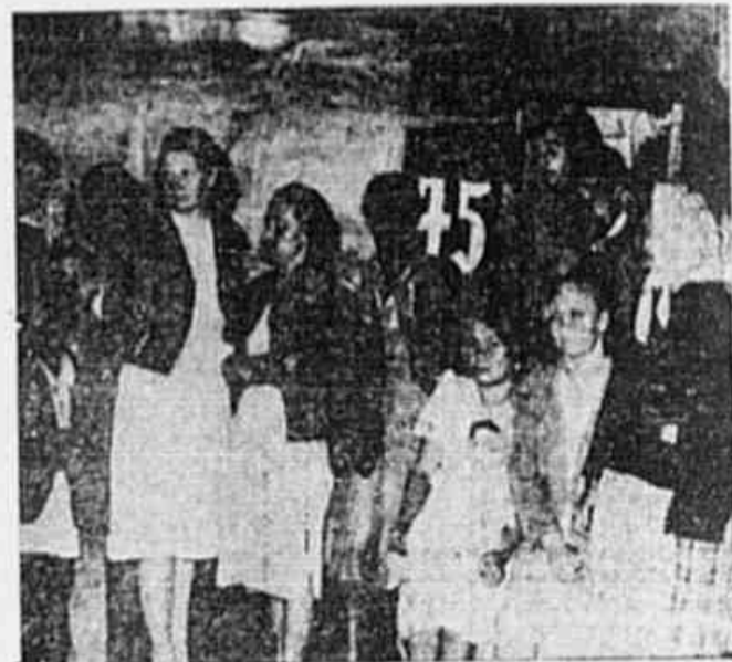
Os populares exibem suas garrafas ainda vazias (e Deus sabe se hoje estarão cheias...), suas canecas, litros, garrafas, uma infinidade de vasilhas. Quando a "vacca leiteira" chega, a rua dos Invalidos já está intransitável de tantos "sofredores", como chamamos uma das nossas entrevistadas em sua linguagem pitoresca, que esperam o momento de adquirir seu litro de leite para alimentar as crianças e os doentes que tem em casa.