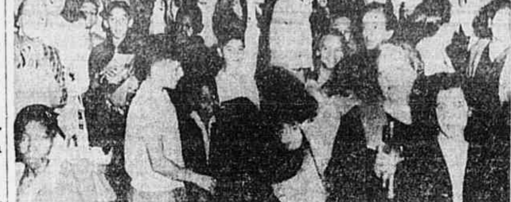
Os caminhões têm números e estes números cara terizam uma rua ou um bairro diante do Entreposto da CEL, onde a fila é imensa, prolongando-se por mais de uma rua, uma senhora que é mãe há pouco tempo e traz ao colo, na madrugada fria, a sua filha, aguarda ao lado de outras pessoas, o momento da distribuição do leite.

Condecorados pelo general Eisenhower com o "Legião Merito" os generais Góis Monteiro, Mascarenhas de Moraes e outros oficiais brasileiros. — Deixou, ontem, o Rio de regresso aos Estados Unidos, o general Eisenhower, embarcando no Aeroporto Santos Dumont, às 23h30 horas.