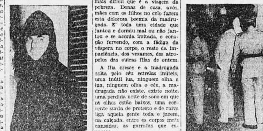
Senhoras desmaleram na longa espera. A vacca leiteira não apareceu. — Estamos sujeitos ao engulfo dos carros. Os carros que aparecem são o 12 e o 19. São muito velhos e quando engulham, adetes...