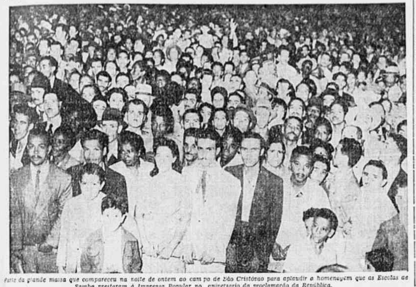
Foto da grande massa que compareceu na noite de ontem ao campo de São Cristovão para aplaudir a homenagem que as Escolas de Samba prestaram à Imprensa Popular no aniversário da proclamação da República.