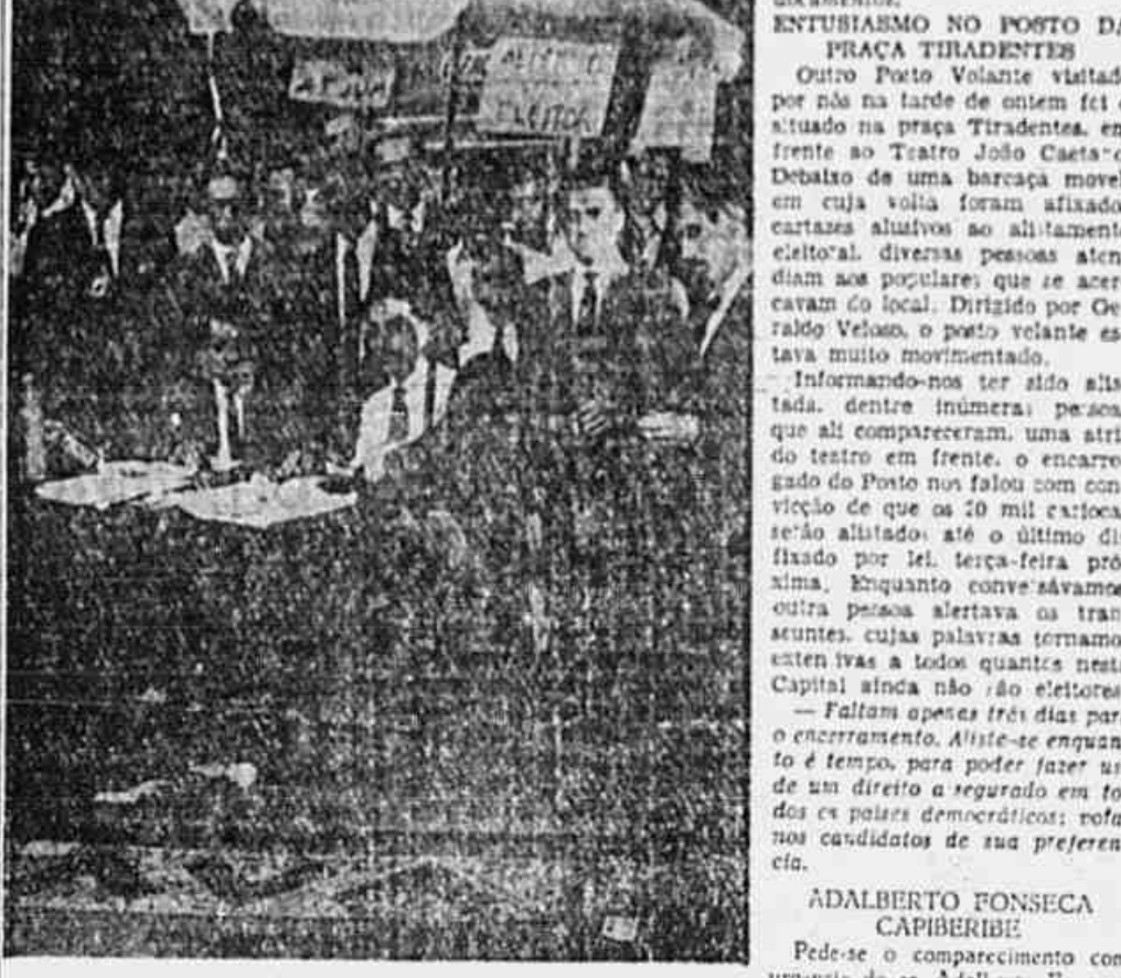
Este posto volante agora está sendo procurado por muitos alistados. Logo que cesse o movimento, o guarda-sol será fechado e a mesinha transportada para outro local mais movimentado...