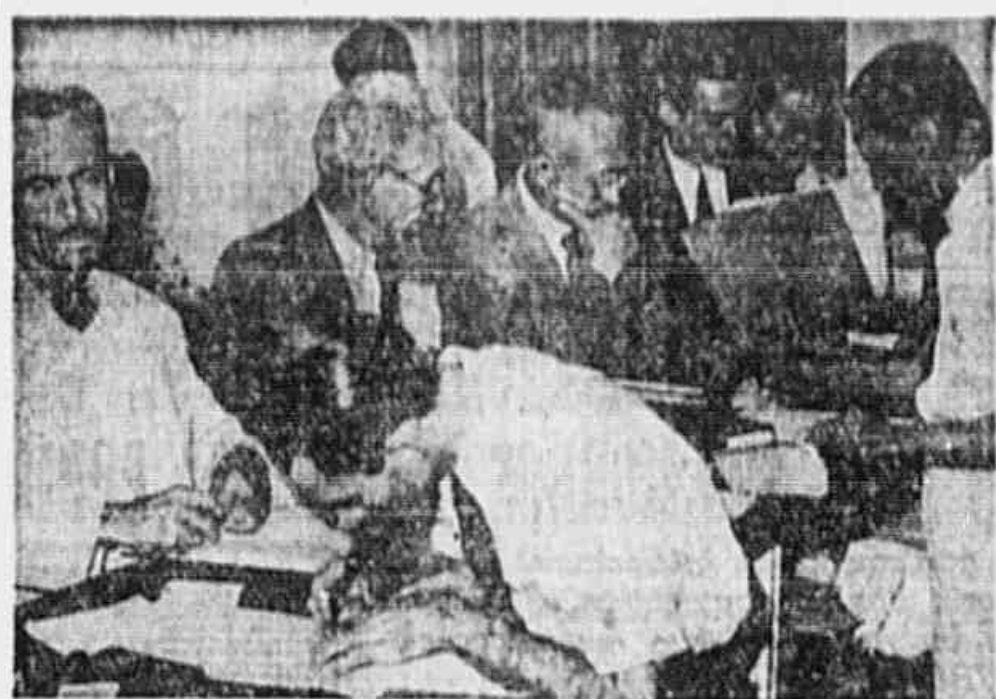
Aspecto de um posto eleitoral do P.C.B., funcionando numa escola