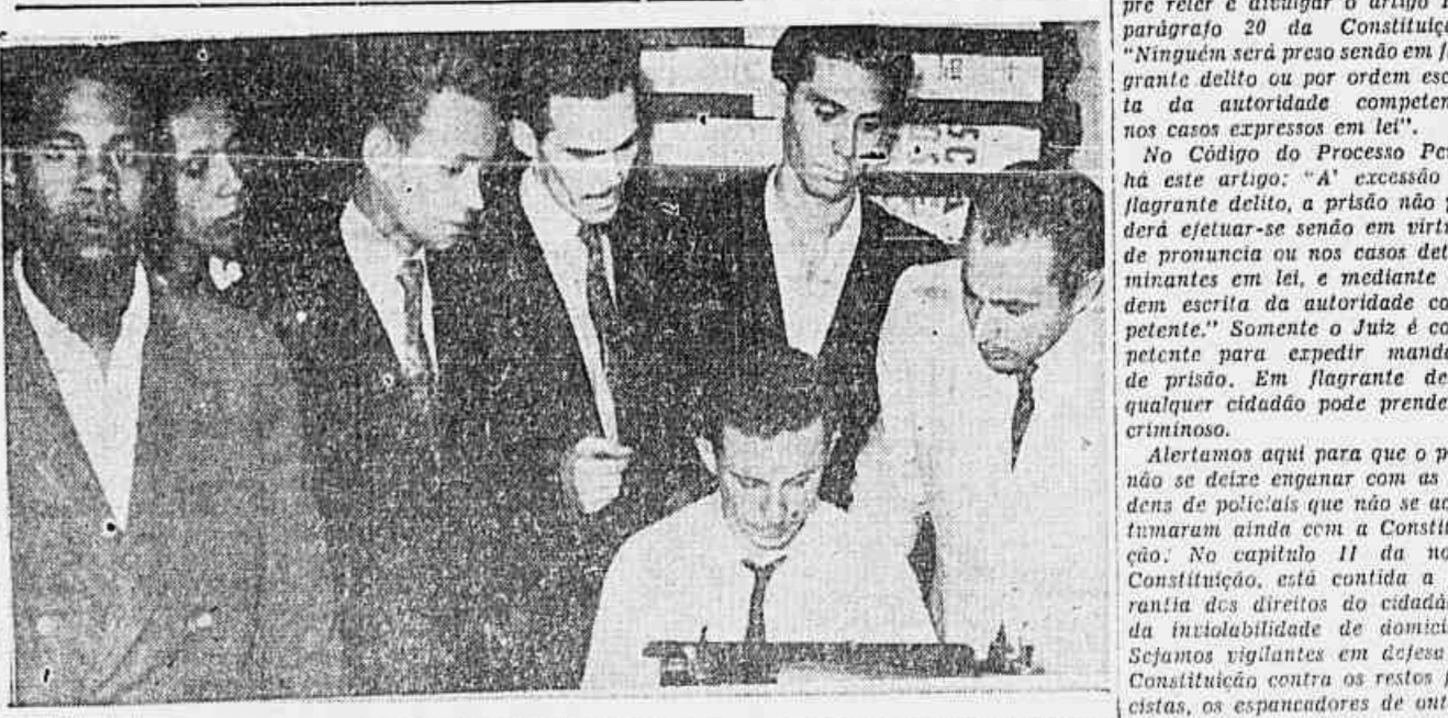
A COMISSÃO PRÓ-SINDICALIZAÇÃO DOS LAPIDARIOS, esteve em nossa redação, a fim de nos comunicar que terça-feira próxima...