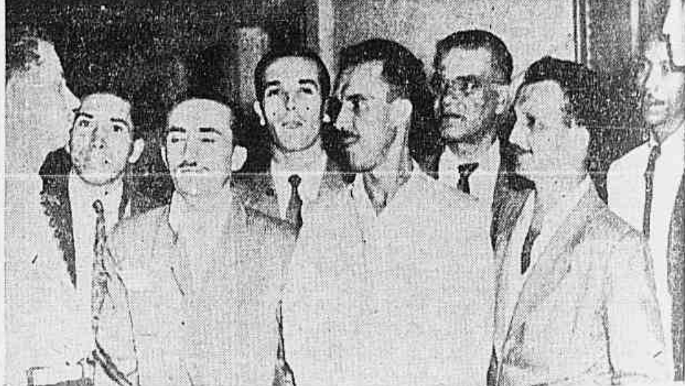
A COMISSÃO DE FESTAS PRO-IMPRESA POPULAR DOS TRABALHADORES NA INDUSTRIA TEXTIL, esteve em visita á nossa redação á fim de nos participar que já realizou...

HOJE Homenagem ao famoso corpo de baile da URCA ÀS 16 HS. MATINÉE ÀS 20 E 22 HS.