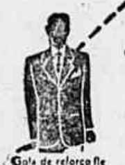
Colar de reforço flexível que equilibra o cambrão e mantém a perpendicularidade da roupa.

Os técnicos em Roupas Feitas, analisando o homem do ponto de vista do vestir-se bem — sua complexão e estatura, seu bom gosto e sua elegância — elegeram o carioca como o tipo padrão. Dal surgiu o "corte carioca" — numa série de 33 tamanhos diferentes, para homens de estatura baixa, média ou alta, de ombros retílineos ou curvilíneos. Agora, sim — você pode vestir a Roupas Feitas que suplanta a sob medida, a roupa "CARIOCA" — cujas características de corte e elegância de linhas se ajustam individualmente ao seu tipo... uma roupa que você, instantaneamente, vê como lhe cai bem e como o padrão se harmoniza inteiramente com o seu gosto — uma roupa que você encontra, já pronta para vestir na Exposição, sem provas demoradas — e sem perda de tempo.