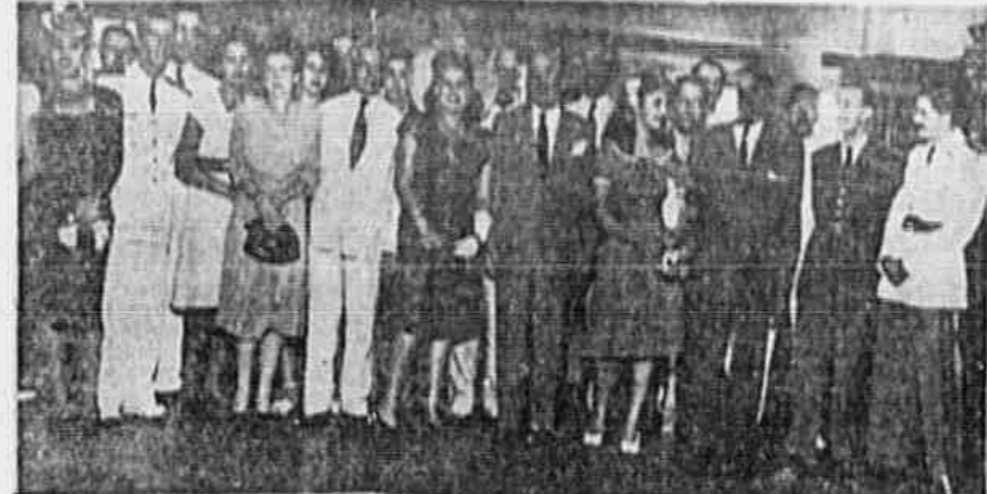
HOMENAGEADO NO CLUBE MILITAR O GENERAL CESAR OBINO - Por motivo de seu regresso do Estado Unidos o general Cesar Obino, chefe do Estado Maior Geral das Forças Armadas e Presidente do Clube Militar foi alvo de significativa homenagem naquela entidade...