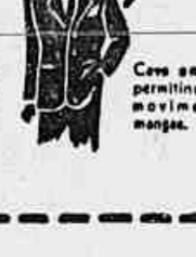
Cum estética, permitindo amplos movimentos das mangas.