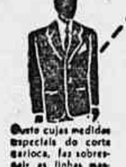
Corte de reforço flexível que equilibra o cambrão e mantém a perpendicularidade da roupa.