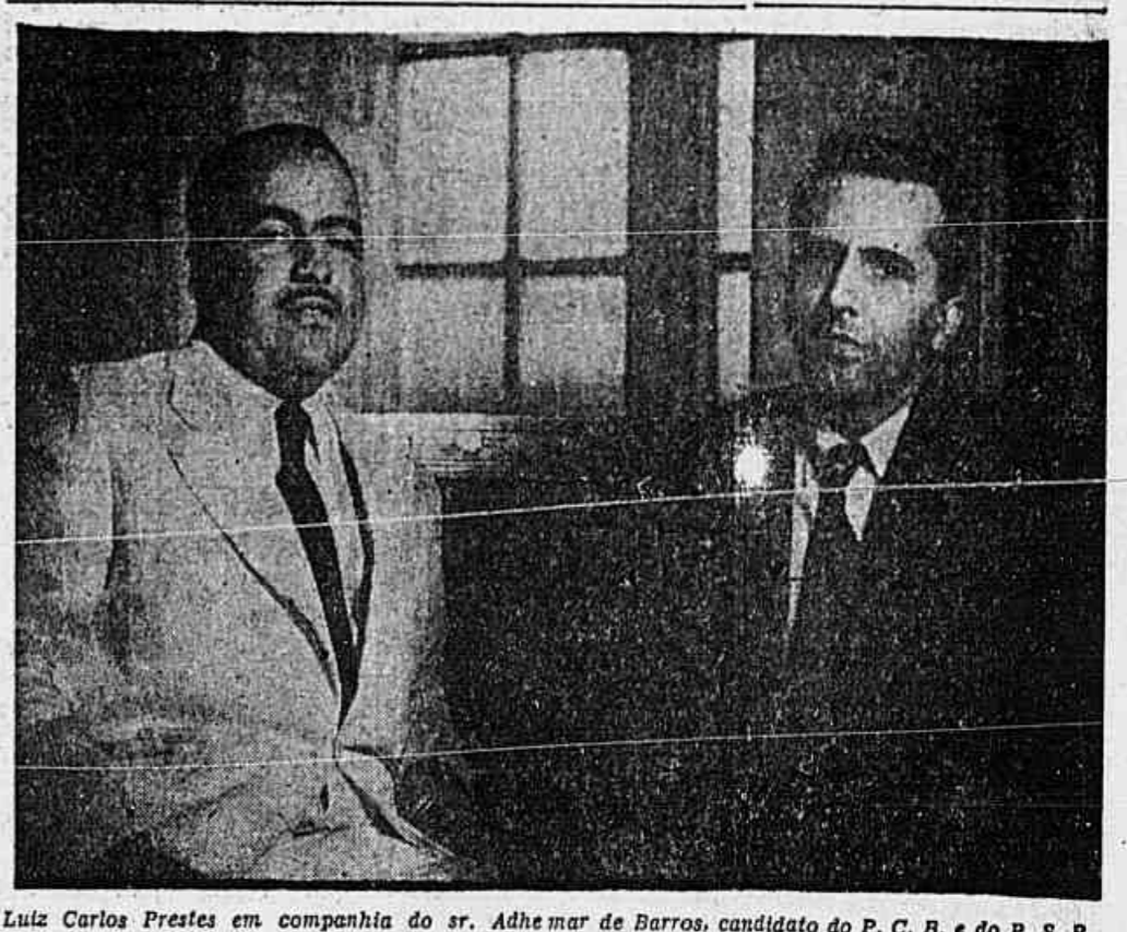
Luiz Carlos Prestes em companhia do sr. Ademar de Barros, candidato do P. C. B. e do P. S. P. à presidência de São Paulo