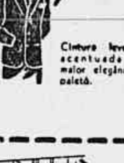
Cintura levemente acentuada para melhor elegância do padrão.