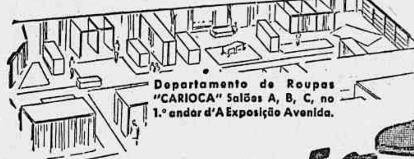
Departamento de Roupas "CARIOCA" Salões A, B, C, no 1.º andar d'A Exposição Avenida.

A Exposição AVENIDA AVENIDA ESQ. SÃO JOSÉ