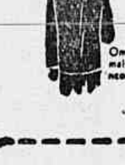
Ombros fortes e mais caídos, retílineos ou curvilíneos.