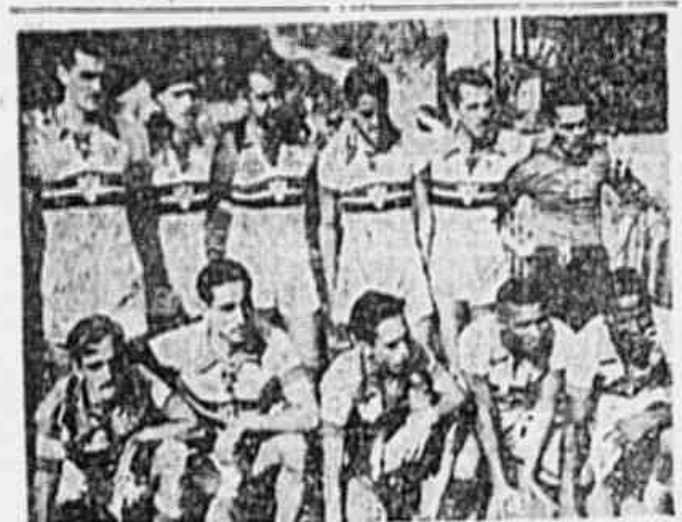
ELAS QUEREM SER OS LEADERS DO "CAMPEONATO POPULAR" — A equipe que aparece na foto acima, é do Lida F. C., concorrente do centro da cidade. A repre. enfática da rua dos Inimigos tem cartas de team animado e vencedor de renhidos coteloj.

Se se pode considerar como vitória a lista da TRIBUNA POPULAR congregando todos os