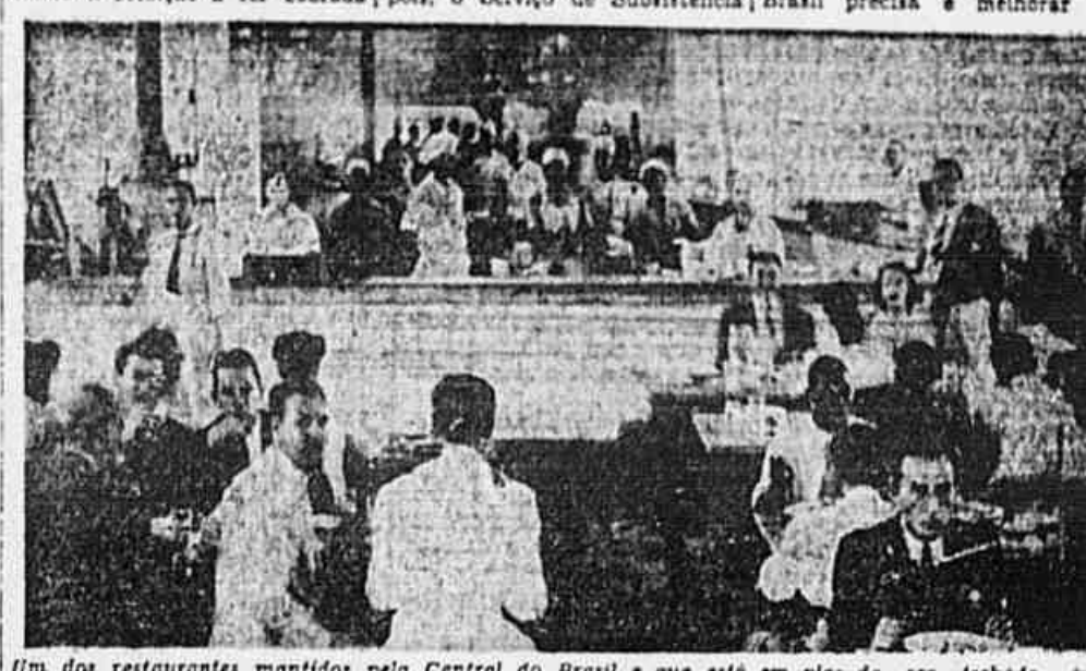
Um dos restaurantes mantidos pela Central do Brasil e que está em risco de ser fechado, em virtude da "política-econômica" do Diretor desta ferrovia

O SERVIÇO DE SUBSISTÊNCIA DA GRANDES LUCROS Outro ferroviário acrescentou: — A alegação de que os restaurantes não prejuízo não se justifica, pois os mesmos estão sujeitos ao Serviço de Subsistência, que dá lucros, explorando outros ramos de negócios como armazém, farmácia, espataria, alfataria, etc. O prejuízo dos restaurantes, se é que existe, é compensado pelos grandes lucros obtidos nos demais ramos. E depois, o Serviço de Subsistência