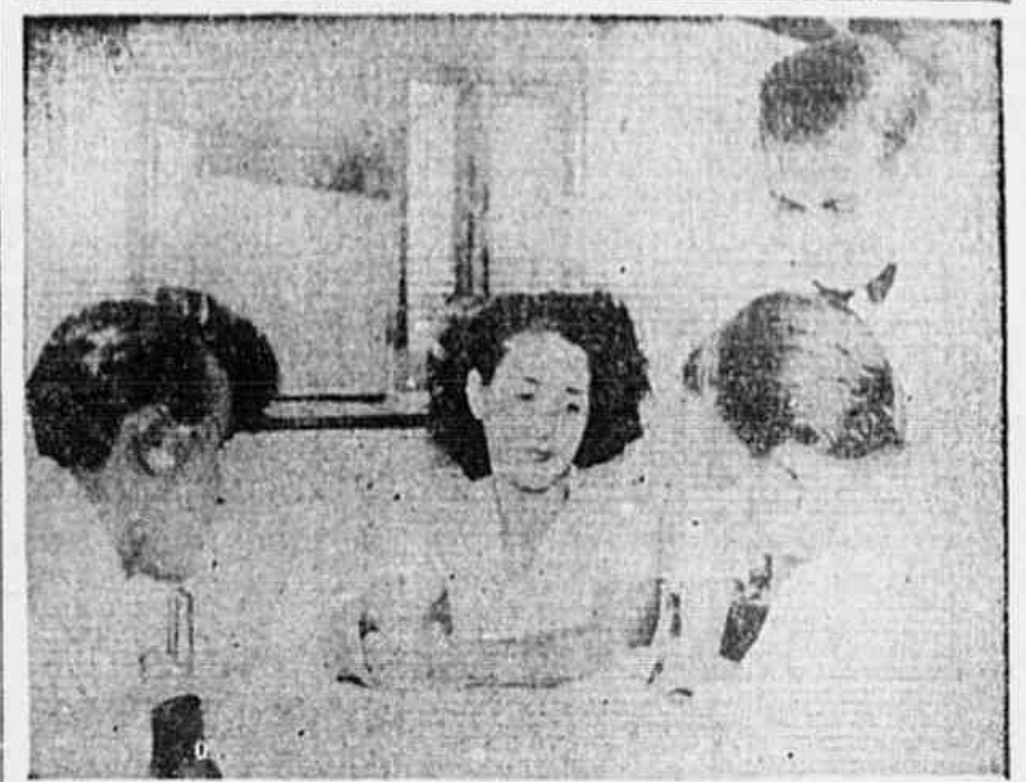
Mostrando o cardápio, os fregueses nos dizem: "qualquer dia o pobre não pode comer". "Chega desse ministro da majoração, já é tempo dele ir passar"

ANO II N.º 518 5.ª FERRA, 6 DE FEVEREIRO DE 1947