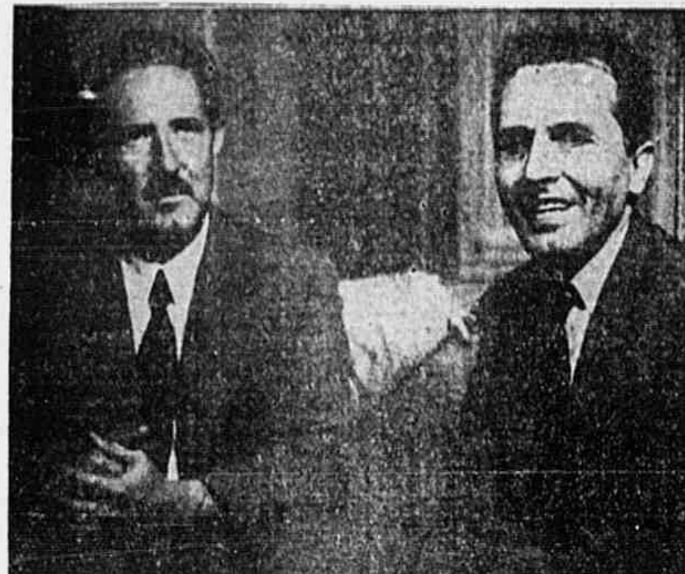
O senador Luiz Carlos Prestes e o governador eleito pelo povo paulista, sr. Adhemar de Barros

Declarações do Senador Prestes à imprensa paulista sobre a importancia da eleição do sr. Adhemar de Barros e sua repercussão nacional e continental