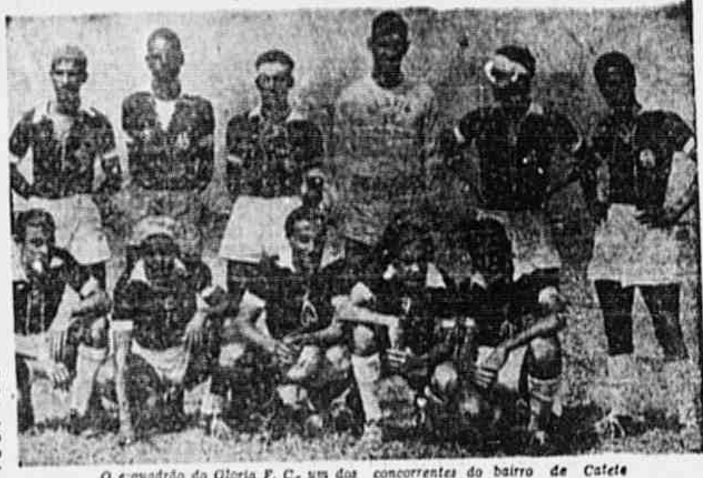
O esquadrão do Gloria F. C., um dos concorrentes do bairro de Cafete

PREMIOS VALIOSOS Os prêmios para os vencedores do certame serão oferecidos pela TRIBUNA POPULAR. São valiosos os troféus e as medalhas que os heróis do maior campeonato de clubes independentes receberão.