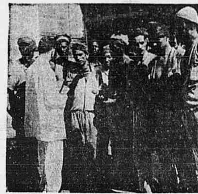
O redator ouviu dos trabalhadores em esgotos a historia da miséria dos homens que ganham o seu pão no sub-solo da cidade

Autênticos heróis desconhecidos são os trabalhadores nos esgotos que, a troco de um salário de miséria, passam horas e horas no interior de infectas valas, que se instala no chão com aparelhos fabricados por seus companheiros de trabalho, conservando-as cu limpando-as com prejuízo da sua própria saúde, pois é sabido que por estas valas correm todas as excrecências da cidade, matérias fecais cuja decomposição produz gases que, penetrando no organismo, produzem enfermidades que no geral conduzem à morte certa. São fezes provindas desde o Palácio Guanabara no Hospital São Se-