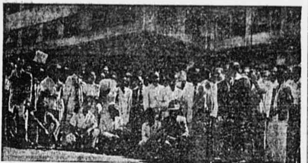
A grande massa de trabalhadores da indústria do papel que compareceu ontem à Junta de Conciliação, quando falavam à reportagem da TRIBUNA POPULAR

compareceram ao Tribunal Regional do Trabalho e foram surpreendidos com a notícia de que o julgamento só seria realizado amanhã, dia 7, às 13 horas, no mesmo local. Era geral o descontentamento entre os trabalhadores. Havia perdido um dia de serviço e muitos queriam culpar a diretoria que, segundo apuramos em fontes seguras, indicava através das palavras do