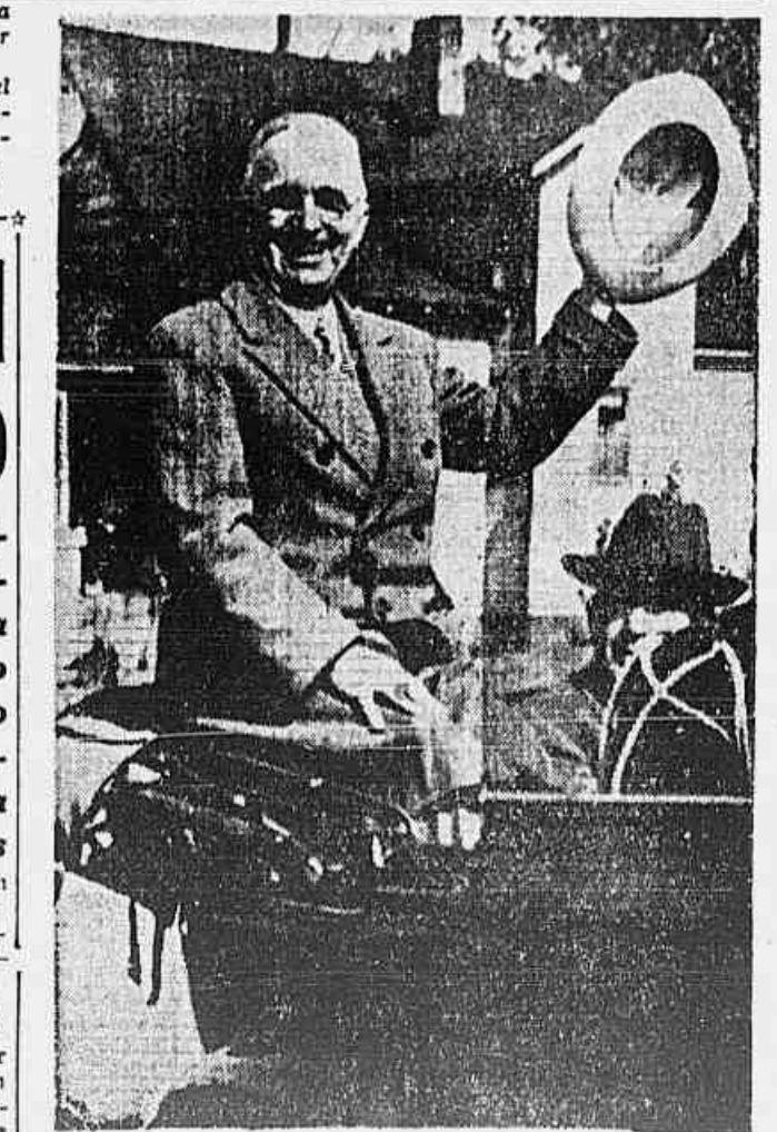
O sr. Harry Truman, presidente dos EE. UU.

provisório da Polónia não tenha cumprido a promessa de realizar eleições livres". Gesto insolito, incompatível com a era de liberdade e autodeterminação dos povos, que tanto sangue e tantos sacrificios