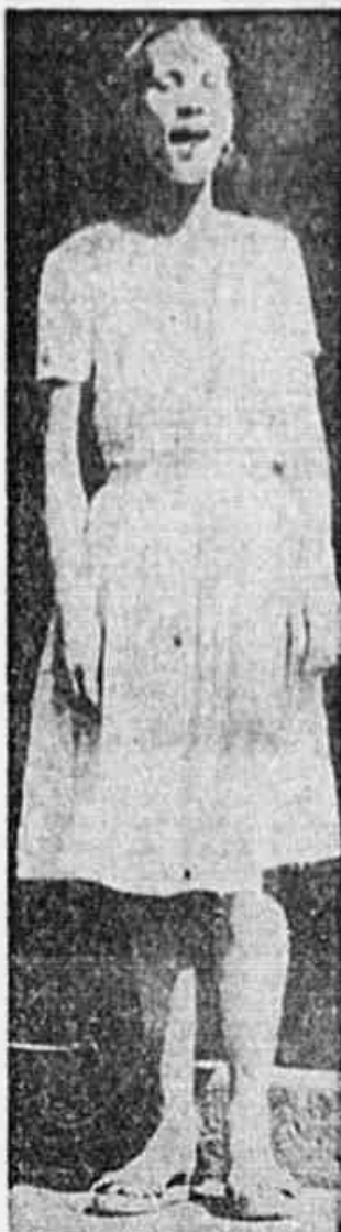
"Moreninha", a Embaixatriz do Samba

O TAMBORIM ESTA' BATENDO DO ESTACIO ATE' OSWALDO CRUZ - Animados os Ensaios da "Recreio de São Carlos", "Cada Ano Sai Melhor" e "Paraiso das Morenas" - A União Geral Inicia a Sua Inspeção às Escolas Filiadas - Todas Comparecerão à Posse de Cavuca e de Moreninha