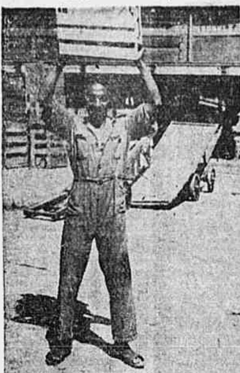
"Cavuca" e Cidadão Samba de 1947 e trabalhador e disciplinado. Vêmo-lo aqui pegando no batente. Saindo do trabalho e num grupo de com panheiros e chefes da Estação de Baçoagem do Mercado Municipal

Realiza-se hoje, às 12 horas, no Departamento de Turismo da Prefeitura, uma reunião da Comissão de Carnaval a fim de tratar da distribuição de auxílios, organização da Comissão Julgadora, assim como a fiscalização dos locais, no sentido de que seja cumprida a portaria do chefe de Polícia.