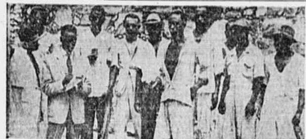
Os trabalhadores em Construção Civil quando faziam a reportagem da TRIBUNA POPULAR.

A União Sindical dos Trabalhadores do Distrito Federal realizou, anteontem, a sua reunião de Conselho de Representantes, a fim de concretizar uma planificação objetiva para a ampla campanha de sindicalização em massa, sob o patrocínio da entidade máxima do proletariado brasileiro, a Confederação dos Trabalhadores do Brasil. A U.S.T.D.F. distribuiu quotas de recrutamento sindical por todas as regiões do Brasil, cabendo a responsabilidade da centralização de tão notável empreendimento às Unidades Sindicais locais. A União Sindical do Distrito Federal ficou incumbida de con-