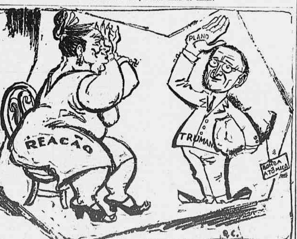
TRUMAN, A NOVA ZAVODIZO

A morte do rei Cristiano da Dinamarca veio pôr termo a uma vida que, depois de longo período de calma, refletindo, aliás, a tranquilidade do seu pequeno mas progressista país, teve, nos últimos anos, quase uma corde de martírio. O príncipe herdeiro Frederik su- cebeu acidentalmente o seu pai no tempo e se tornou o rei Frederik IX. O rei Cristiano está em estado de coma há horas antes de sua morte, tendo toda a família real se aglomerado ao seu leito. O rei Cristiano, que governou a Dinamarca durante 35 anos, dom-