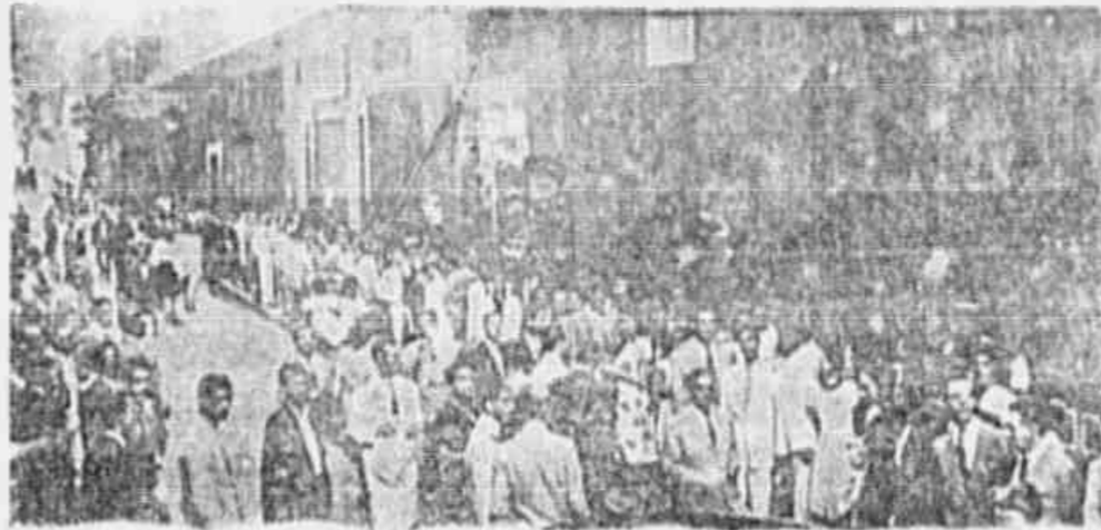
UMA PILA DIFERENTE - Há a fila da carne, do leite, do açúcar e de outras complicações. A que vemos acima é diferente...