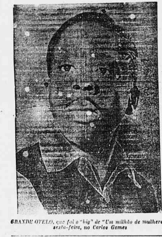
GRANDE OTELO, que foi o "big" de "Um milhão de mulheres", sexta-feira, no Carlos Gomes