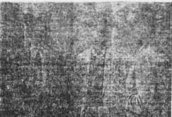
Preparativos grandes comemorações para o 1.º de Maio deste ano...

Preparativos nos sindicatos e grande entusiasmo dos trabalhadores Rápida enquetes da «Tribuna Popular» sobre a grande data universal