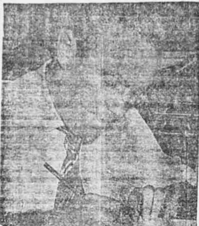
Egydio Squell, enviado especial da TRIBUNA POPULAR no Paraguai...