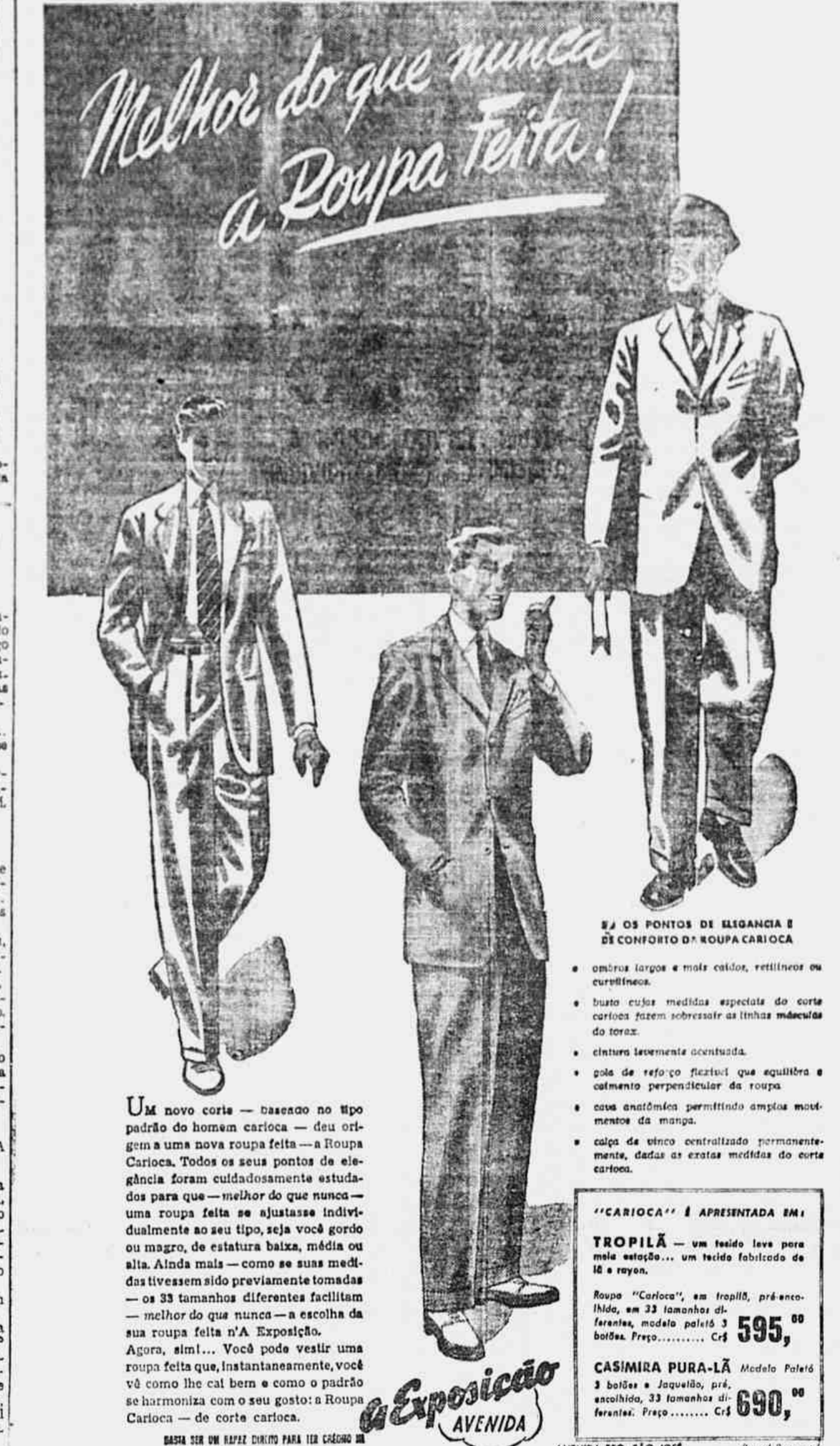
OS PONTOS DE ELIGANCIA E DE CONFORTO DA ROUPA CARIOCA

A TURMA CHILENA - Outro favorito do Sul-Americano é o Chile. Também acham-