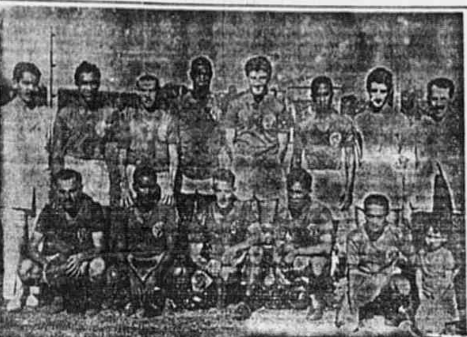
O SUDAN A. C. POSANDO PARA A "TRIBUNA POPULAR" — O "time" do Sudan A. C. continua crescendo no "Campeonato Popular"...

Prontos Os Adversários De Amanhã FLAMENGO E VASCO COMPLETOS PARA A GRANDE BATALHA A principal peleja de amanhã entre o líder invicto e o Flamengo reúne as atenções gerais. A partida, se tiver a dirigir-la um bom árbitro, promete um desenrolar dos mais interessantes.