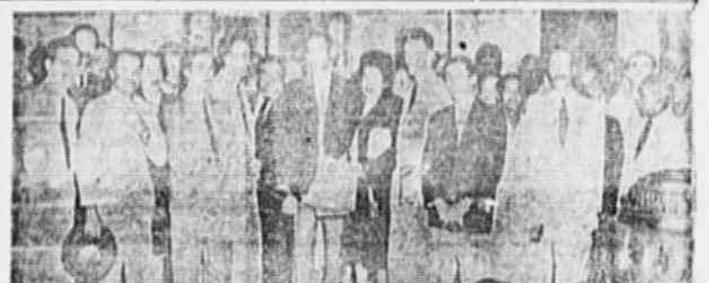
Os servidores públicos em companhia do deputado Benício Fontelle, no Palácio Tróvão.

ANO III - N.º 608 - SABADO, 24 DE MAIO DE 1947