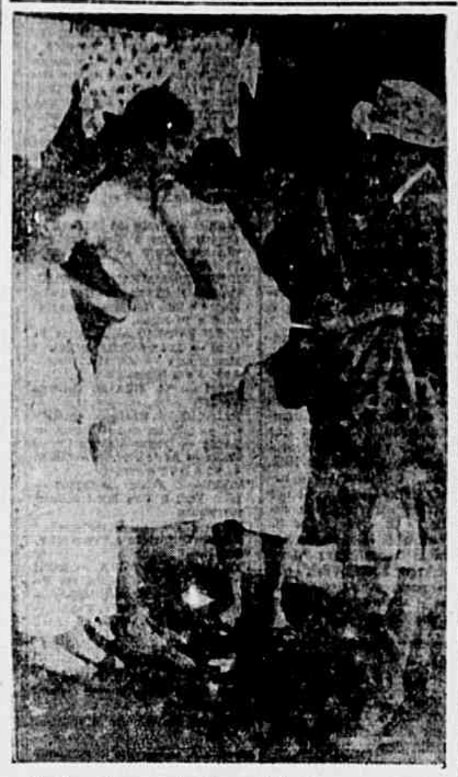
Moradoras do morro dos Macacos, falam à nossa reportagem