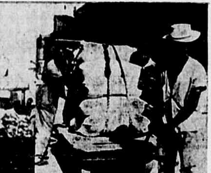
Atendendo às imposições do imperialismo americano, a ditadura melhorou o seu negócio da farinha de trigo.

As causas da explosão também não foram apuradas.