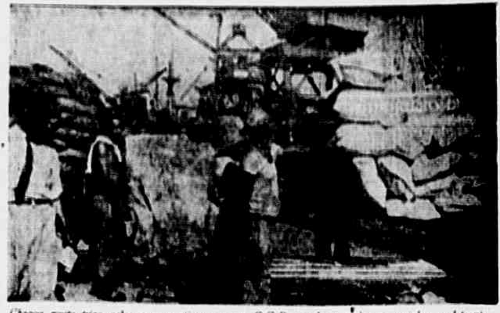
Carrega muito trigo pelos preços antigos, mas a C.C.P. resolveu ajudar os machos e deturmar o seu aumento

ABATIDOS DOIS AVIÕES INIMIGOS BATÁVIA, 23 (U.P.) — Avíões