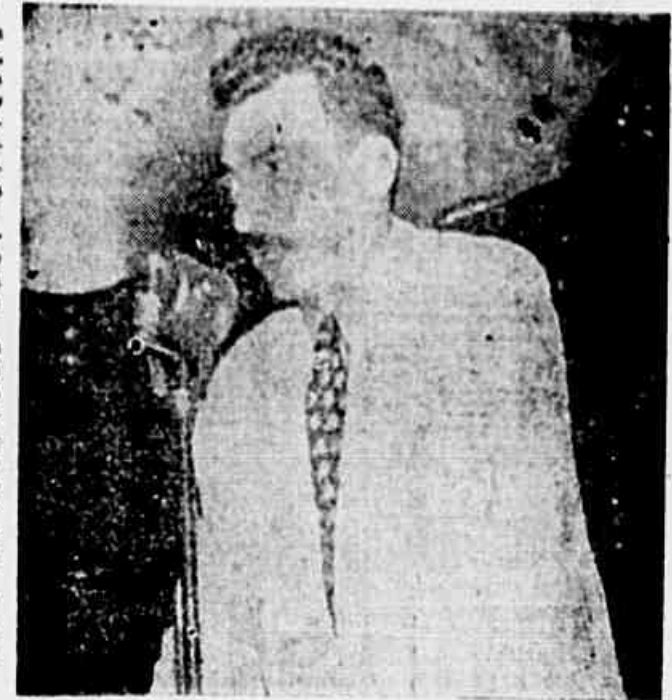
Deputado Jorge Amado