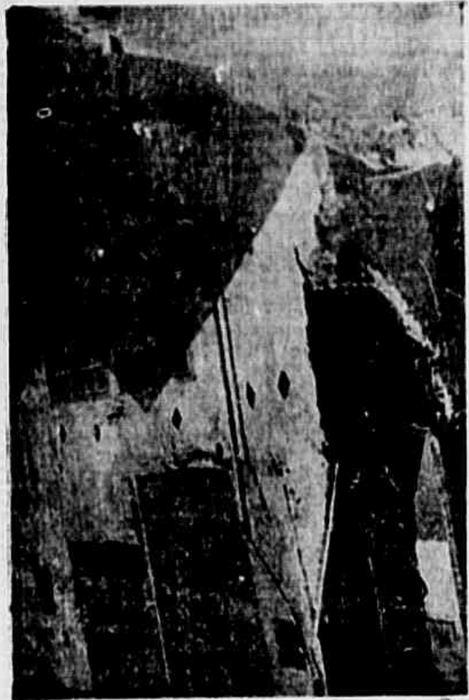
O prédio poderá desabar a qualquer momento soterrando mais de 100 pessoas

Um velho edifício de dois andares da rua João Cardoso prestes a ruir sobre várias residências próximas — Panico entre os moradores — O Corpo de Bombeiros e a Prefeitura se recusaram a socorrer as pessoas prejudicadas