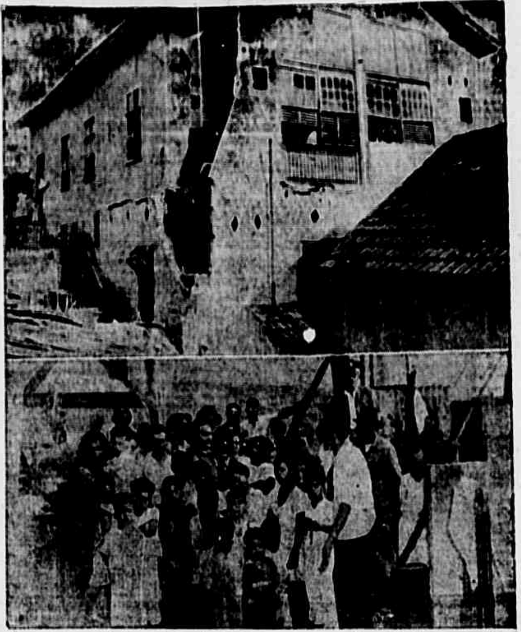
Alarmados com o desabamento em vias de se resumir, os moradores falam à nossa reportagem

PETROPOLIS, 28 (Serviço Especial da Agência Nacional) — Os parlamentares que integram as diversas delegações na Conferência Inter-americana para a Manutenção da Paz e da Segurança no Continente, visitam amanhã a Câmara dos Deputados. Nesta ocasião usaram da palavra, além do senador Vandenberg, da Delegação Americana, diversos delegados.