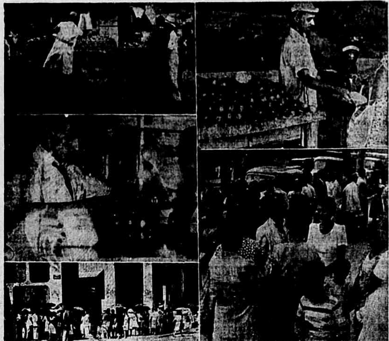
Cresem as filas, escasseiam os gêneros, sobem os preços, enquanto os salários permanecem os mesmos. A vida do carioca torna-se cada dia mais aflitiva, mas os homens do governo, incapazes de resolver esses problemas, atiram-se contra a Constituição

Prevaleceu, na sessão de ontem da Câmara dos Deputados, a obstrução do sr. Souza Costa ao importante projeto que regula uma das mais sentidas reivindicações dos trabalhadores