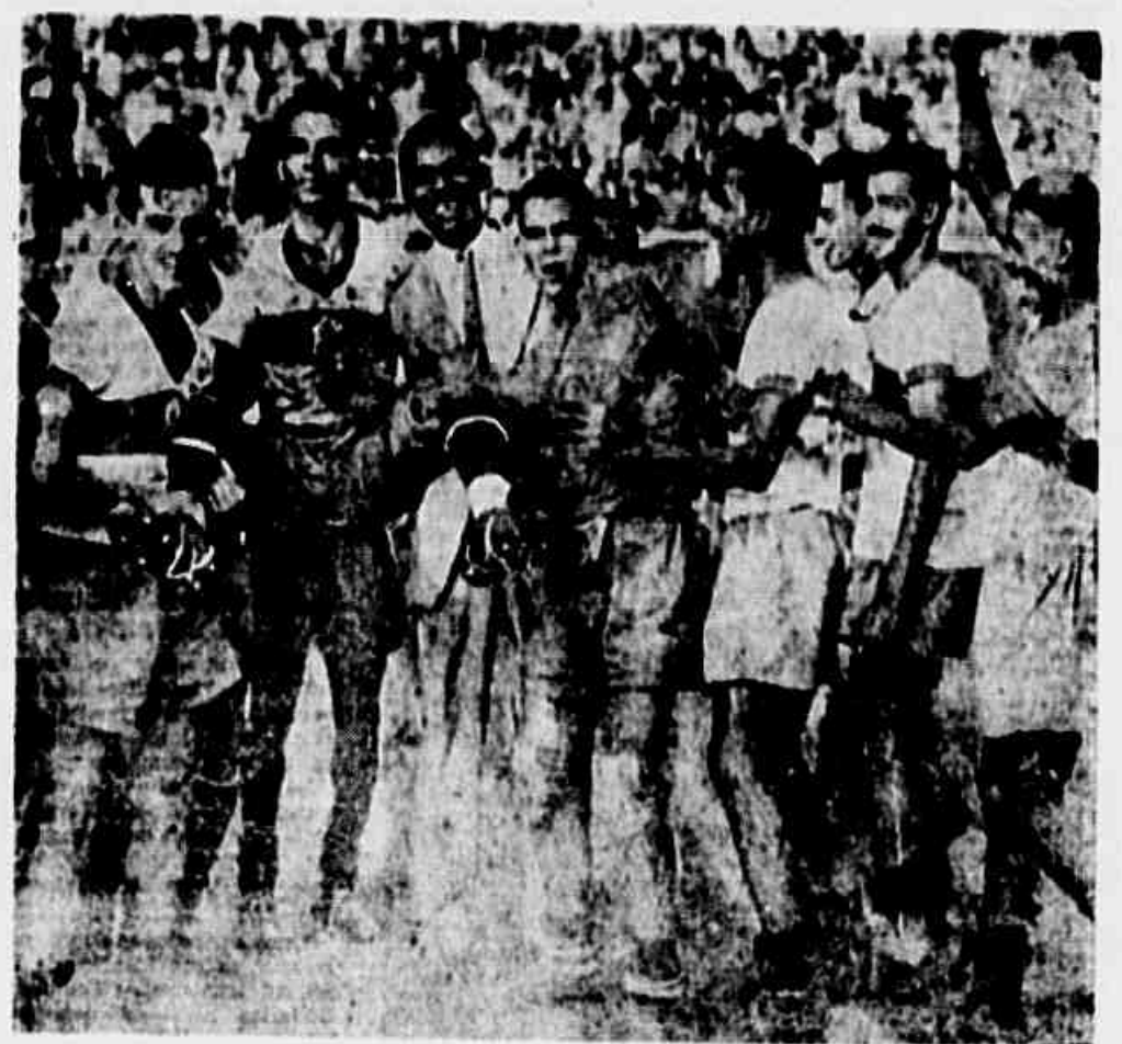
Jogadores do Olaria na comemoração de uma vitória. Domingo, esperam os leopoldinenses a repetição da cena acima, no entusiasmo de um sensacional triunfo sobre o Fluminense

Depois de um proveitoso ensaio realizado na tarde de quarta-feira, Botafogo e Vasco voltam hoje a campo para as últimas manobras preparativas para os choques de amanhã e domingo.