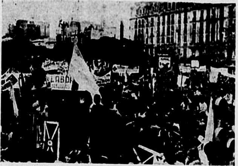
Aparece no clichê ao alto uma das grandes manifestações laboristas a Perón, no Plaza de La República, em Buenos Aires

Há sintomas dos primeiros sérios desentendimentos na alta direção do grupo governamental argentino — Para desviar os olhares do povo da verdadeira situação, o presidente ataca a vanguarda da classe operária