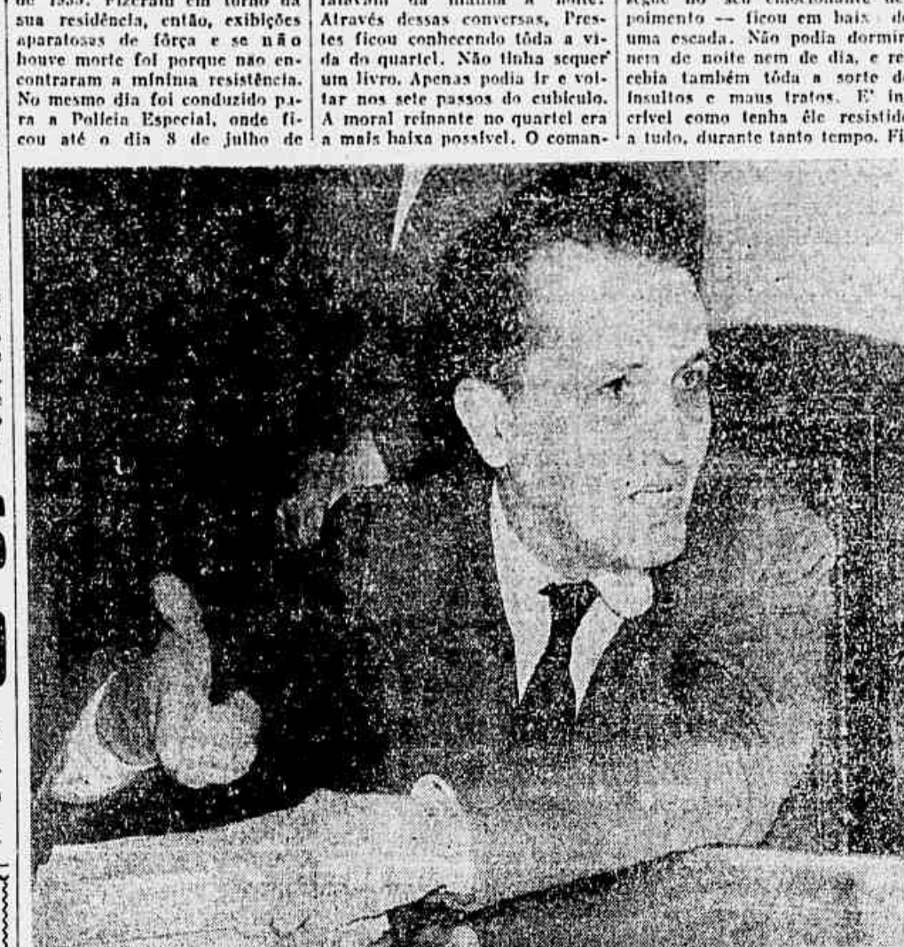
O Senador Luiz Carlos Prestes, quando presta o seu depoimento, ontem, à tarde, na Comissão de Inquérito para Investigar os Atos Delituosos da Ditadura