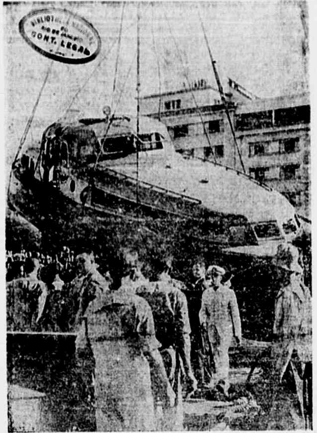
A lancha "Peruana", suspensa pelo guindaste da cabria do Ministério da Guerra, no momento em que chegava ao Caís Pharoux

Foram mais de 20 horas e meia daquele dia, quando a lancha "Peruana", da Frota Carioca, deixava o Caís Pharoux, rumo a Niterói, com 105 passageiros. Em sentido contrário, navegava a barca "Icaral", da Companhia Cantareira, em demanda desta capital. A altura da Ponta do Galvão, inopinadamente, frutificou a periclitosa catástrofe: a "Peruana" remeteu contra a proa da "Peruana". Estremeceu e gemeu o seu arcabouço. Todos compreendem a brutal realidade: o naufrágio. Formou-se o tumulto a bordo da pequena embarcação. Gritos lancinantes cortam o ar. Atropêlo e confusão não se fazem esperar: cada qual procura salvar-se como pode. Estabelece-se, no interior da Peruana, tremenda luta. Cada qual, primeiro, se esforça, por se desvincular dos outros a fim de se atirar à água e, assim, ganhar possibilidade de sobreviver àquela fatal corrida para o fundo do mar.