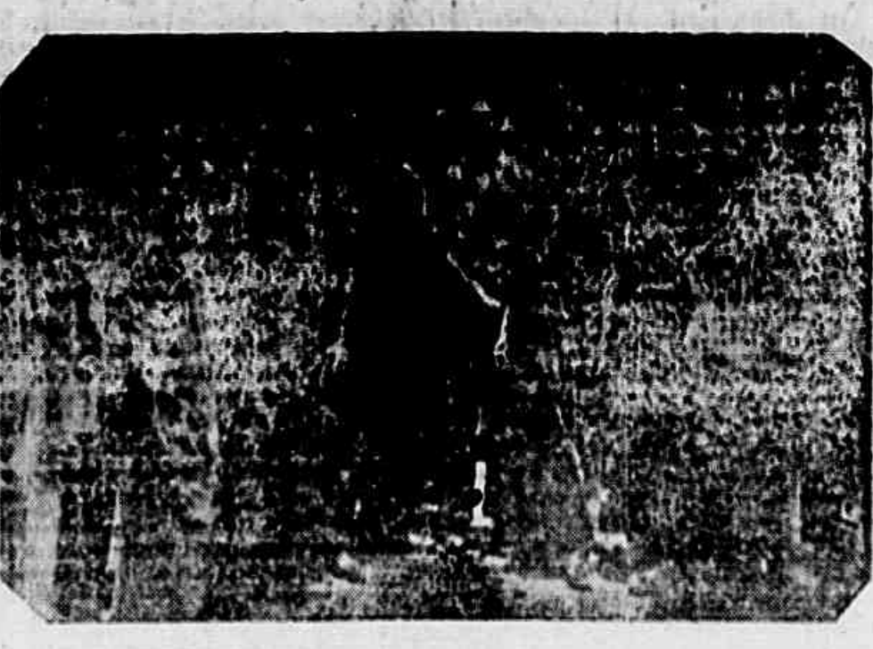
OS MOBILIZADOS PARTICIPAM EM MASSA DA CONCENTRAÇÃO DO DIA 21...

Essa posição do governo argentino vem demonstrar, mais uma vez, que o Hamarati adotou uma política falsa e injuriosa, rompendo com o governo de Moscou para criar, internamente, um clima de insegurança propício ao desenvolvimento de novos golpes contra a democracia.