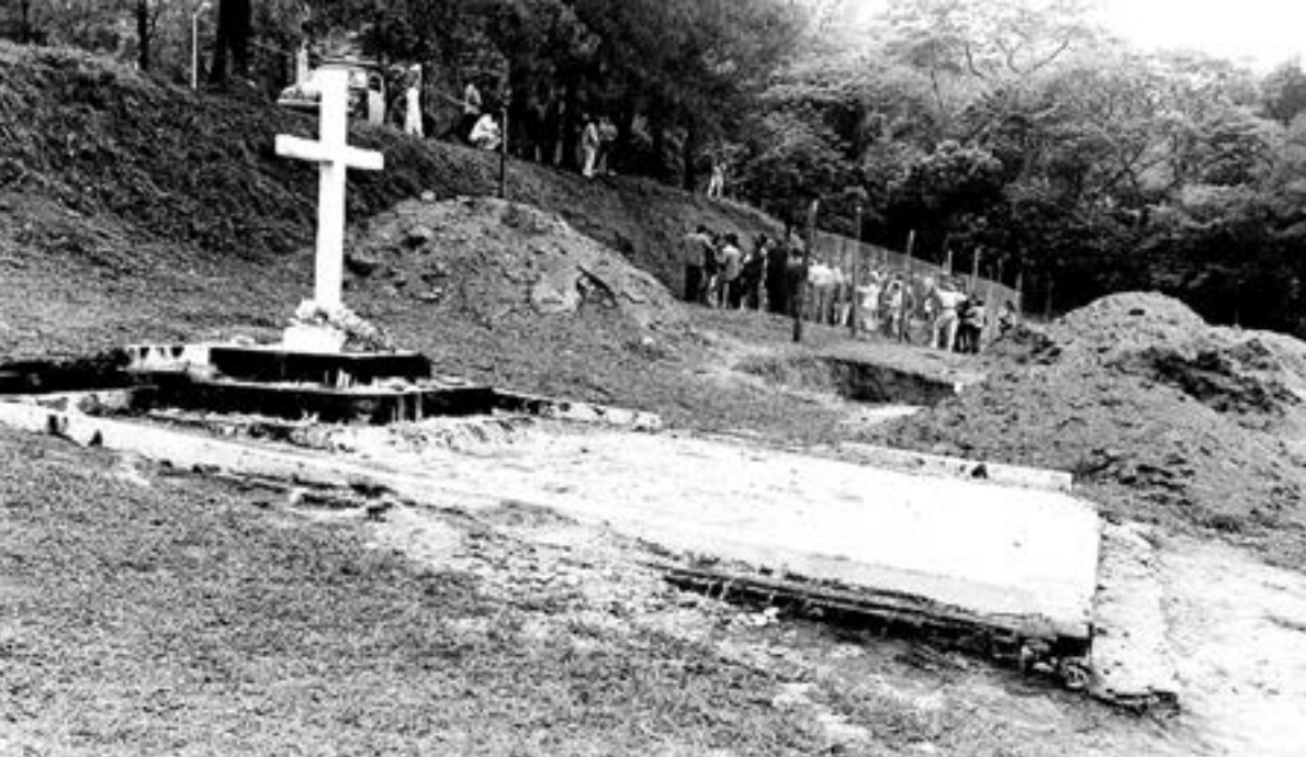
Escavações no Cemitério Dom Bosco para localização da área total da vala clandestina.

Arquivo CMSP/CPI Perus: desaparecidos políticos.