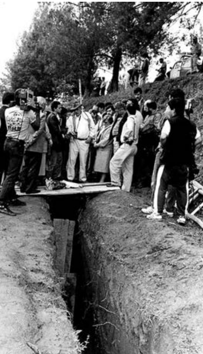
A prefeita Luiza Erundina em visita ao Cemitério Dom Bosco, em Perus (SP), logo após a abertura da vala clandestina.

Arquivo CMSP/CPI Perus: desaparecidos políticos.