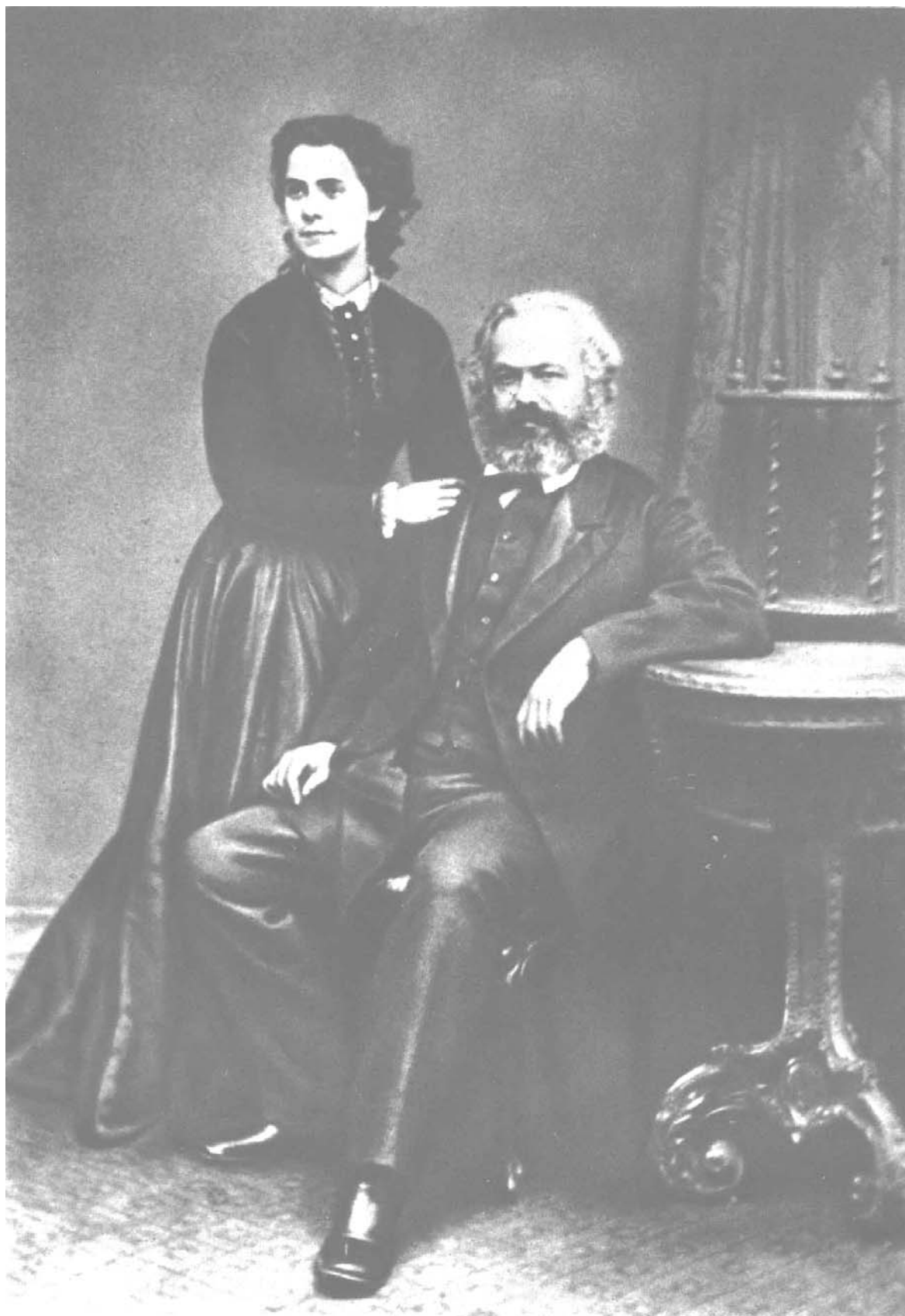
Карл Маркс со старшей дочерью Женни 1869 г.