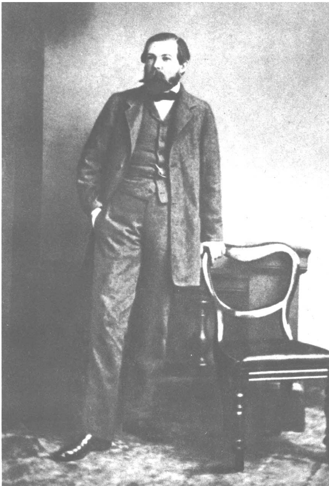
Фридрих Энгельс (60-е годы)