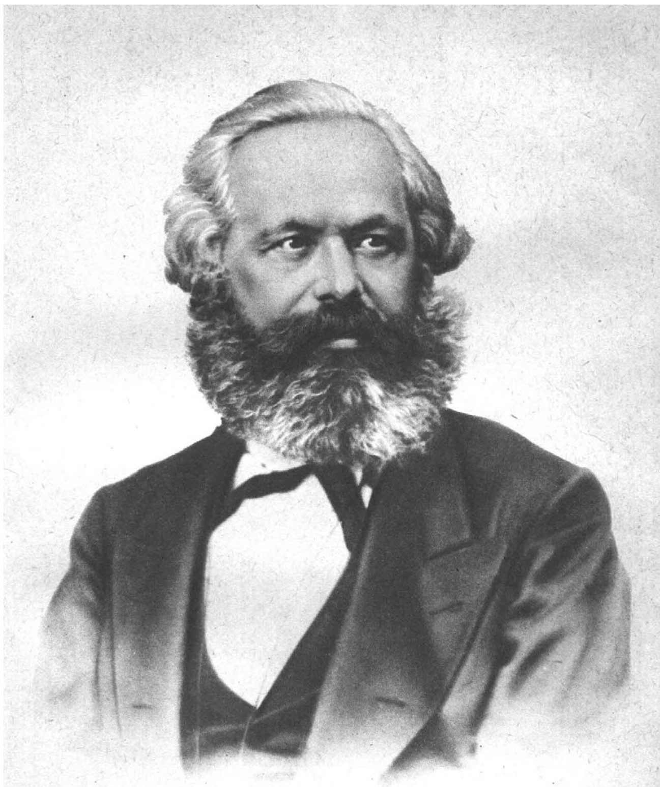
Карл Маркс 1867 г.