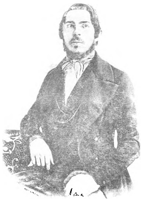
Ф. ЭНГЕЛЬС В СЕРЕДИНЕ 40-Х ГОДОВ,