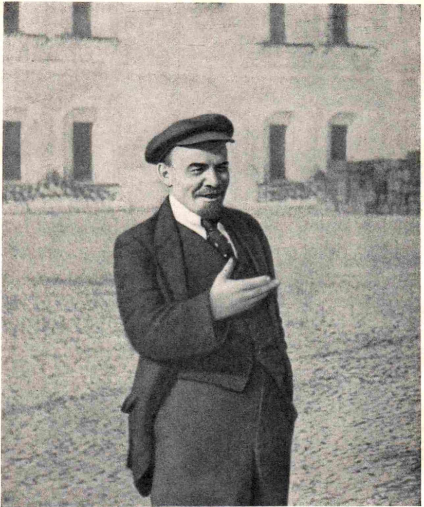
V. I. Lenin kävelyllä Kremlin pihalla haavoittumisen jälkeen. Valokuva, syyskuu 1918.