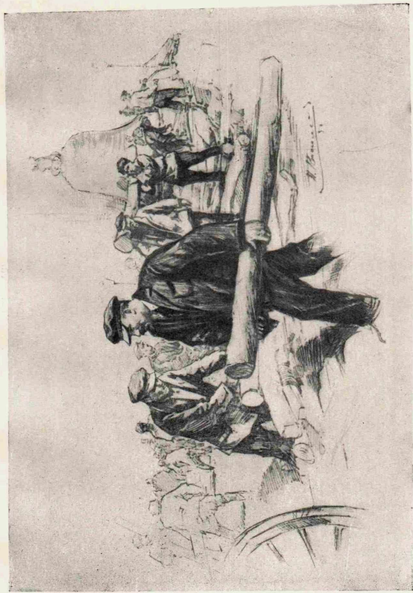
V. I. Lenin Yleisvenäjäisissä talkoissa Kremlissä toukokuun 1 p:nä 1920. Taiteilija P. Vasiljev'in piirros.