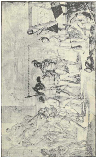
Vangittuja orjia kuletetaan onkalolihin.