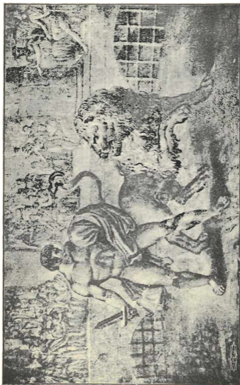
Gladiatori ja leijona