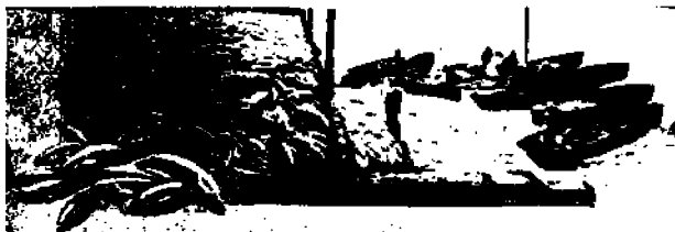
Tuoreet lohet känäriin tuotuna

“Näytä, kuka on näitten miesten agentti,” sanoi pursimies.