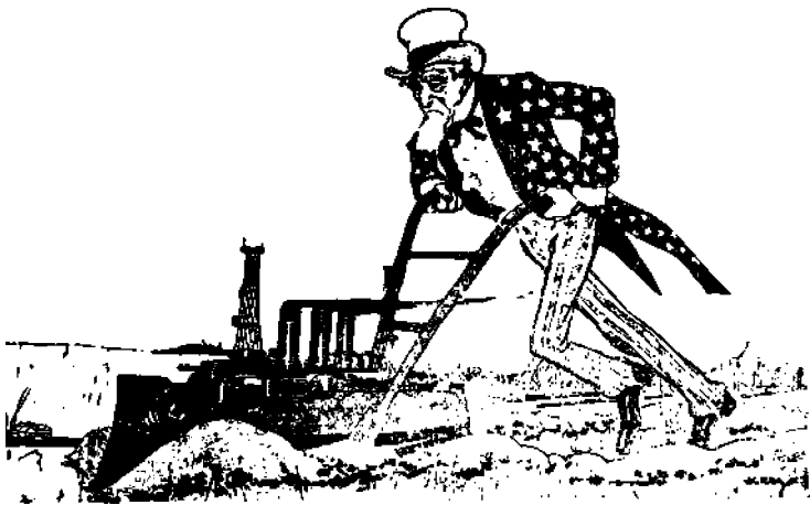
Kuinka miljoonia tuhlataan

”Toinen kansainvälinen sosia- lististen naisten kongressi Köpen- haminassa asettuu taistelussa so- taa vastaan Pariisin, Lontoon ja Stuttgartin kansainvälisten sosia- lististen kongressien päätösten pohjalle. Se näkee sotien syy- n kapitalistisen tuotantotavan ai-