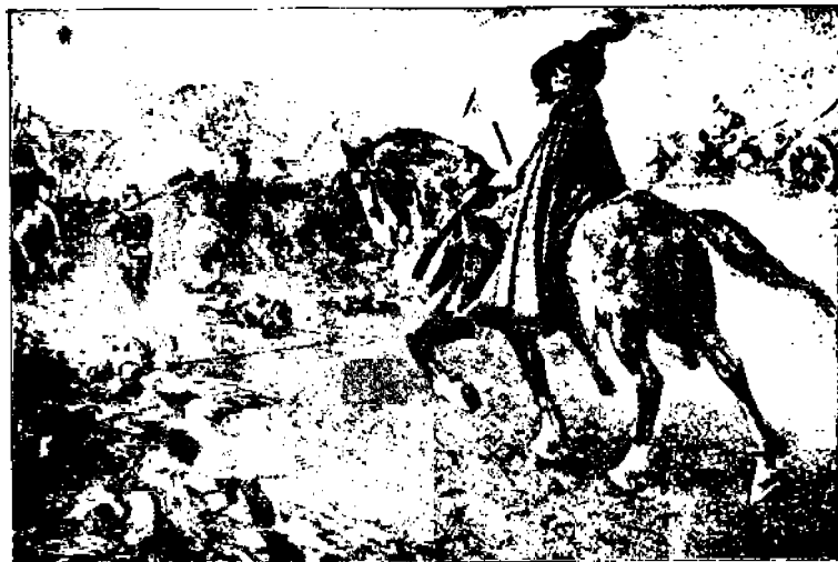
Kaikkein suurin sotakenraali — kuolema

Kaikkien maiden työläisillä ei ole mitään riitaisuuksia tahi epä- sopua, jotka voisivat antaa aihet- ta sotaan. Sodat ovat nykyisin seurauksena kapitalismista, erit- täinkin kapitalististen valtioiden maailmanmarkkinoilla käymästä äärimmäisestä kilpataistelusta, se- kä militarismista, joka on sisäi-