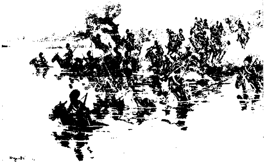
Kasakat perääntyvät erään joen yli.

19. Kolmipäiväiset ankarat taistelut päättyivät läntisessä Galitsiassa, jossa saksalaiset kärsivät mieshukkaa, mutta suoriutuivat voittajina.