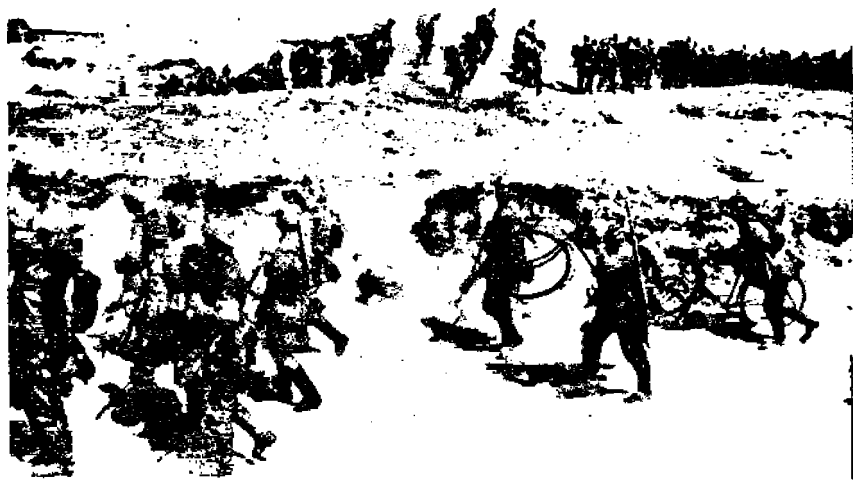
Saksalaiset marssivat Libauseen rannikkoa myöten.