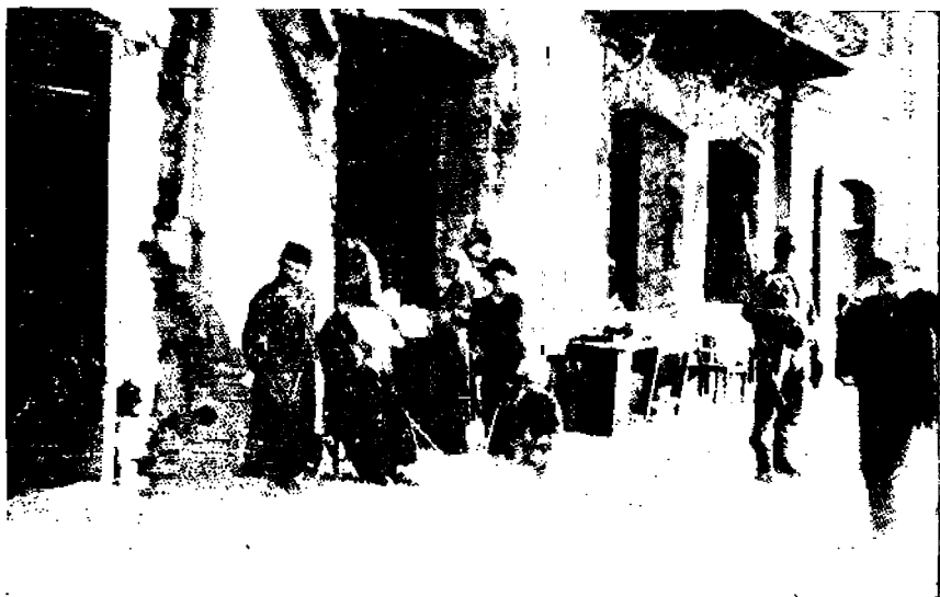
Hävitettyjä juutalaiskoteja Radomyslissä.

16. Saksalainen laivasto-osasto meni Pohjanmeren ylitse ja pommitti Scarboroughia, Whitbyta ja Hartlepoolia, Englannin koillis-rannikolla,