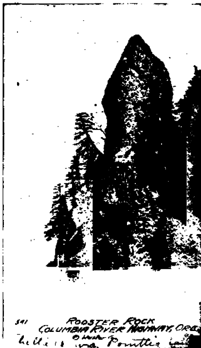
541 ROOSTER ROCK COLUMBIA RIVER HIGHWAY, OREG.

ritettyinä sini-, purpura- ja amethystiiväreillä, reunustettu ja täplitetty kiltävän valkoisella, läntisen auringon ruusuinen valo heijastaen niiden korkeimmilta huipuilta, jylhinä, yksinäisinä, vuori-ilmestyksien oraakkeleina, niin suuremmoisina, niin kauniina, niin uskollisina ne seisovat, näyttäen siltä kuin ne olisivat täällä aina olleet läpi ikuisien aikojen odottamassa tulkitsejaa — Tämän näköalan edessä me ku-