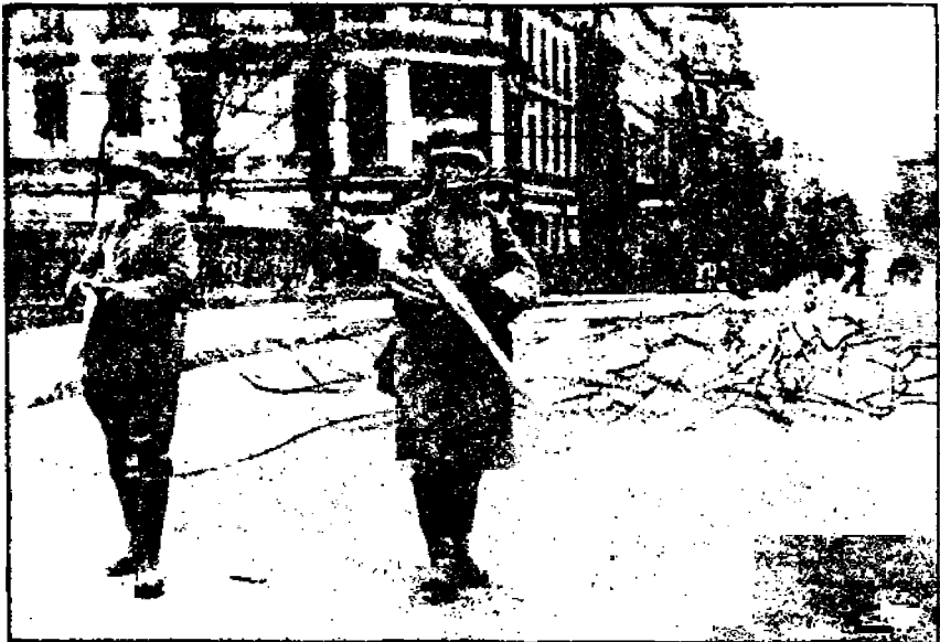
Vallankumouksellisten työläisten teurastaja, Ebert-Noske-hallituksen sotilaita Berliinin kaduilla viimeisen vallankumousyrityksen aikana.

den riistäminen siis lisäsi katkeruutta ja vallankumouksen yrittämisinnostusta samaan aikaan kun edellämäinintun lain käsitteily valtiopäivillä lähenee loppuaan, ja laki tiedettiin tulevan hyväksytyksi, ellei mitään ratkaisevaa tapahdu. Kun sitte lakiehdotus oli toisessa lukemisessa tammikuun kolmantenatoista päivänä Die Freiheit-lehti vetosi viiteentoista berliiniläiseen ammattiyhdistykseen ja kehoitti heitä saapumaan iltapäivällä kello 3 mielenosotukselle valtiopäivätalon edustalle. Noin sata tuhatta työ-