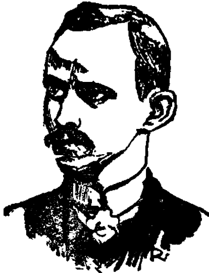
O. V. KUUSINEN.

hasta kuningaskunnasta. Besarabialalaiset, jotka eivät ole tyytyväisiä rumaanialaisiin valtaajilnsa, heitetään Dniesteriin. Hallituksen viranomaiset ovat pöyhkeillen julistaneet Rumanian parlamentissa olevansa ylpeitä tällaisesta asiaintilasta.