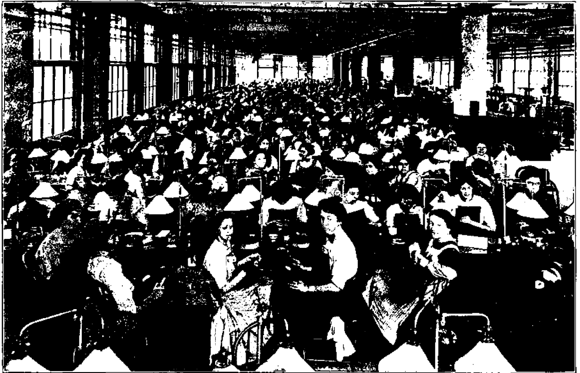
Kuva nykyajan tehdasteollisuudesta, jossa työskentelee tuhansia naisia saman katon alla.

Kapitalistit eivät maksa perheenisälle sen enempää kuin yksinäisellekään miehelle. He katsovat vain aina, miten paljon he voivat saada työläisen työntuloksista liikevoittoa.