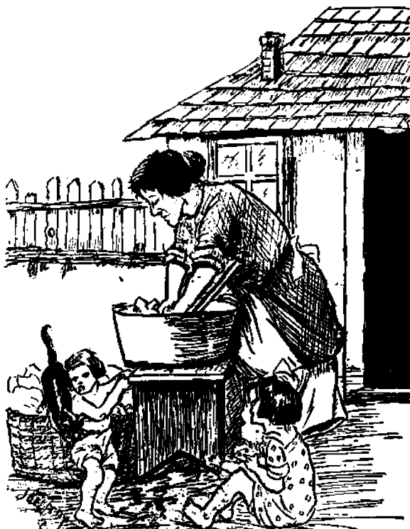
Vanhanaajan kotiteollisuus pyykkiammeineen piti kodin koossa. Uudenaajan tehdasteollisuus on hävittänyt sen.

Alexandra Gripenberg, "Naisasian Kehitys Eri Maissa" nimisessä teoksessaan, kuvailee laajasti sitä olotilaa, mihin nai-