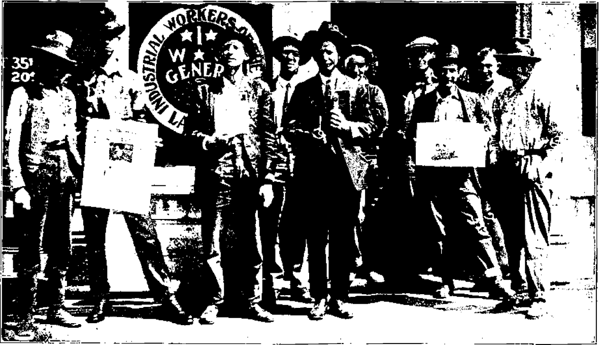
I. W. W:n haali, Denver, Colo.