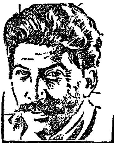
Stalin, Venäjän kommunistipuolueen kirjuri ja leniniläisten teorian "erikoistuntija," kuten Työmies tietää lausua.

kielletään. Vai haluaako Työmies tosiasioista vaikenemalla vakuuttaa, ettei Venäjällä hallitsevassa asemassa olevat ole perustaneet ryhmiä ja pitäneet salaisia kokouksia? Ne ovat toimineet julkisesti ja salaisesti tukkiaksensa täydellisesti suun niiltä, jotka eivät ole voineet hyväksyä kaikkea sitä, mitä Stalinin sakki työväenliikkeen — työläisten diktatuurin — nimessä suorittaa. Jos Työmiehellä olisi ollut vähänkin johdonmukaisuutta, niin se olisi esittänyt lukijoilleen oppositiioniin kuuluvien selityksiä ja lausuntoita myös, eikä vain hallitsevassa asemassa olevain. Esitämme tässä joitakin kohtia siitä julistuksesta, jonka oppositiioniin kuuluvat huomatuimmat henkilöt allekirjoittivat ja antoivat Venäjän kommunistipuolueen keskuskomitealle, joka sen sitten julisti "hävietyksi." Siinä m. m. sanotaan seuraavasti: