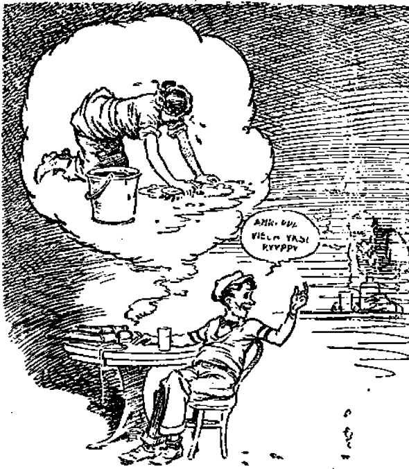
Äiti — Lapsi — Yhteiskunta

suurten miesten esimerkkiä. Käy, kuten Chicagossa, josta ylläolevan kuvan aihe on lähtöisin, että äiti on työssä, pojan pitäisi olla koulussa, mutta hän onkin salakapakassa toisten seurassa.