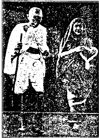
Mahatma Gandhi ja Sarojini Naidu, Intian kansallisen liikkeen johtajat. Molemmat ovat nyt vankilassa brittiläisen sortopoliittikan uhreina.

Nykyinen kapinaliike ei ole ensimmäisiä Intian historiassa, vaikka se on nykyisessä muodossaan ensimmäisiä. Englannin sortopo-