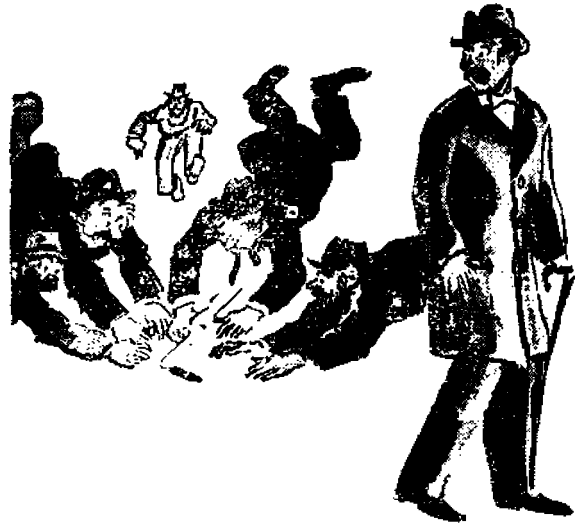
Eräänlaisia "katutais-elua", jota voidaan vielä tälläkin vuosisadalla helposti nähdä.

Tätä kammottavaa ajanpituutta poistamaan on muodostunut erikoinen teollisuus, moninaisine muotoineen, joka auttaa ajan kuluttamista maksua vastaan. Teatterit ynnä muut samansuuntaiset paikat ovat aivan sitä varten että niissä poistetaan liikkoja tunteja ihmiselämästä. Tämänlainen