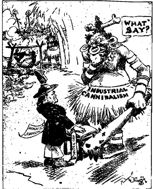
Vaikeasti käännettävä ihmisyyöjä.

Yksi niistä on terästeollisuudesta ja koskee työläisiä välittömästi. Kongressin laatima laki edellyttää — ainakin sen henki, jos ei kirjain — että työ- ja palkkaehdoista kullakin teollisuusallalla on sovittava omistajain järjestön ja työläisten järjestön kesken. Ja työläisten järjestöillä tarkoitetaan järjestöjä jotka ovat työläisten itsensä perustamia ja ylläpitämiä, eikä työnantajain. Terästeollisuuden omistajat eivät sellaisesta ajatuksesta pitäneet. He olivat tottuneet kohtaamaan työläisiä järjestymättöminä yksilöinä. Jos nyt piti heitä kohdata järjestettynä joukkona, tahtoivat he tämän järjestämisen itse toimittaa. Ryhdyttiin perustamaan yhtiönunioita. Niitä varten oli terästuotannon koodiin laadittu erikoinen osansa.