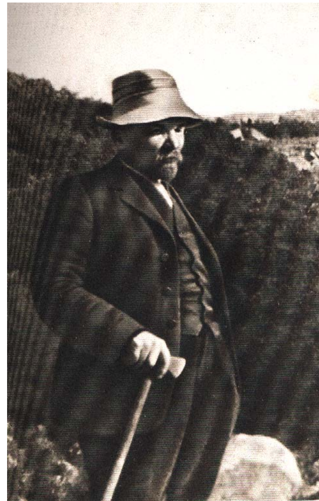
V. I. Lê-nin ở Da-cô-pa-nơ 1914